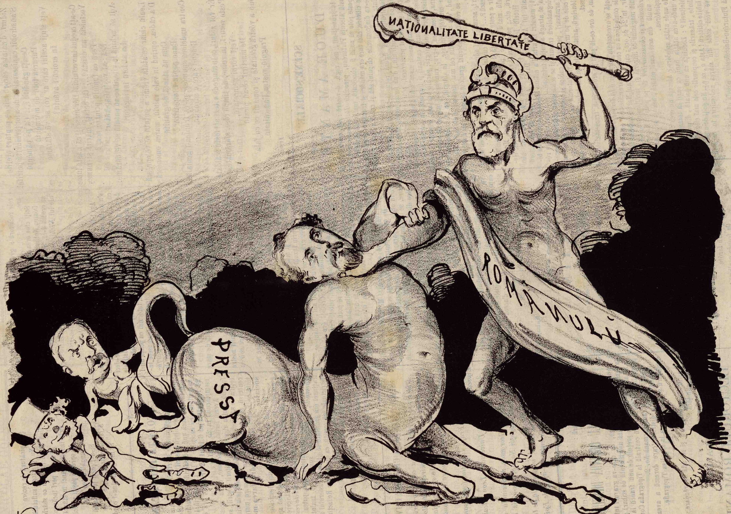
SCENE MITOLOGICE. — Trecutul se asemăna cu prezentele. — Tiseu sdrobesce Minotaurul.