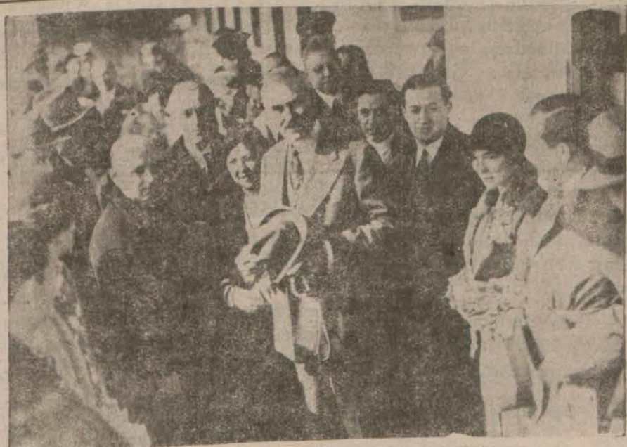
Sabık Amerika sefiri kendisini teşyi edenler arasında..