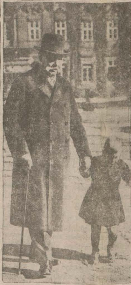
12,171,000 Rey kazanan Mareşal Hindenburg

Türkiyeyi büyük bir teessürle terkettiğimi söylemeği bile zart adederim. Şimdiye kadar her tarafta gördüğüm misafirperverlik ve samimi hüsnü kabul beni pek mütehasis etmiştir. 1923 te Lauzanne da ilk defa olarak tanıdığım İsmet Paşa Hz. nin bana karşı gösterdiği o zamandan beri müteaddit defalar tezahuru ne şahit olduğum dostluk asar, benim için pek kıymettardır ve kıymetini daima muhafaza edeceğim. Türkiye'de geçirdiğim beş senenin iyi hatırasını daima muhafaza edeceğim ve buraya daha bir çok defalar gelmekten büyük bir haz ve memnuni-