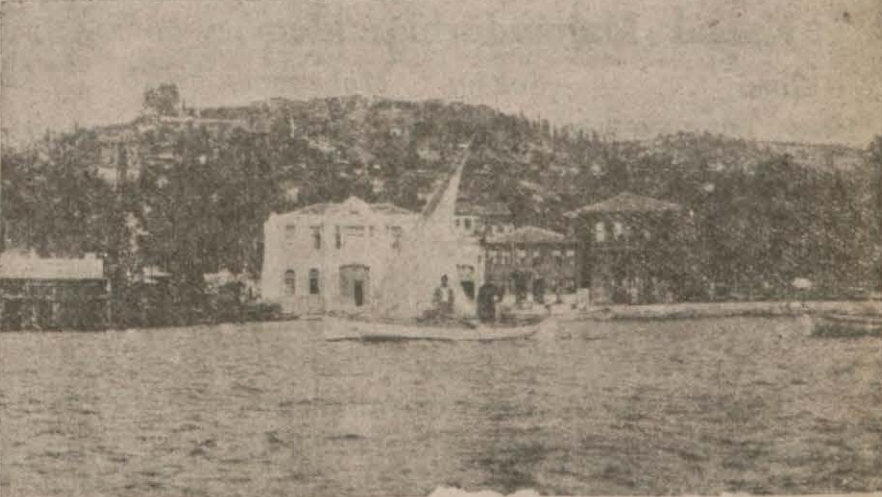
İzmit iskelesi ve umumi manzarası

KOCAELİ: (Milyet) — Vilâyet maarifinin dört sene zarfında gösterdiği inkişaf lisanı şükran ile yad edilemeyecektir. Adapazarında Kemaladdin Sami Paşa tarafından temelleri atılmış olan 9 dershaneli Gazi mektebi tadilen ikmal olunmuştur. Maarif vekâleti mimarlarından Müsyü (Egl) in tertip eylediği plan lar dairesinde Hendekte İsmet paşa, Geyvede Kazım paşa ve Gepzede Eşref Bey namlarıyla üç mektep yaptırılmıştır.