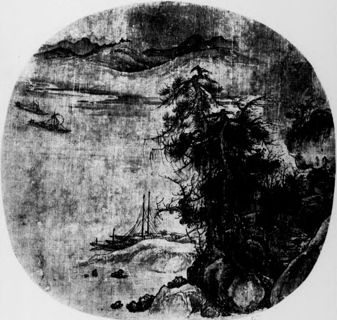
精本、法設色、八寸一分五厘、橫八寸四分五厘、無字識、郭熙清遠堂御題詩、春水放舟、春帆趁潮游、可知事連順、須念盛當 郭熙小傳、詳見本刊第五十七期、