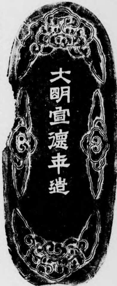
原藏古物陳列所、縱五寸五分、橫二寸一分、厚四分五厘、圖一尺三寸二分、重七兩二錢、制作與本刊第四八五期所載永樂國寶墨相同、面「國寶」二楷字、填金、背「大明宣德年造」六隸字、填藍色、