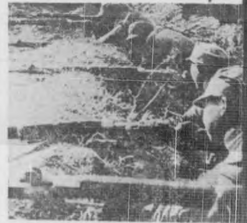
↑ 東線上我兵之頑敵