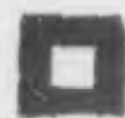
← 東線上我增援部隊