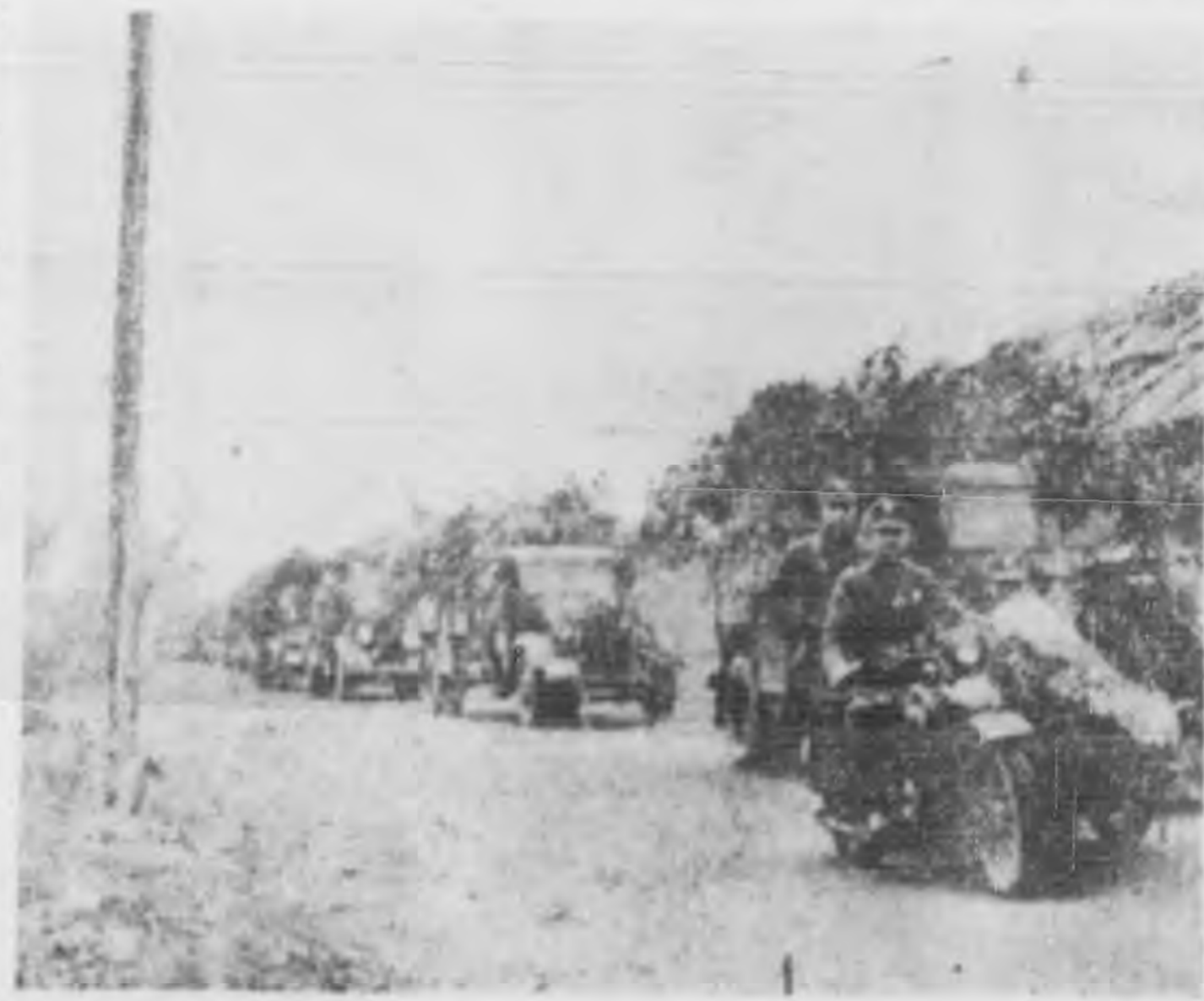
北線上我兵匍匐前進殺敵