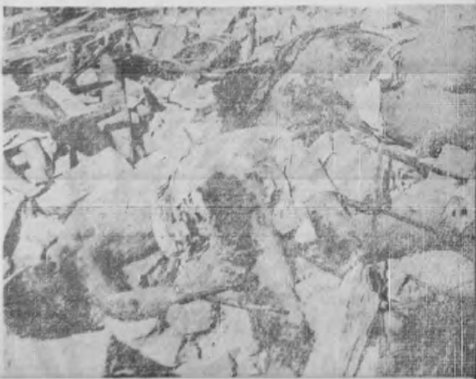
↑ 東綫上 被炸死的 兩個無辜 幼童