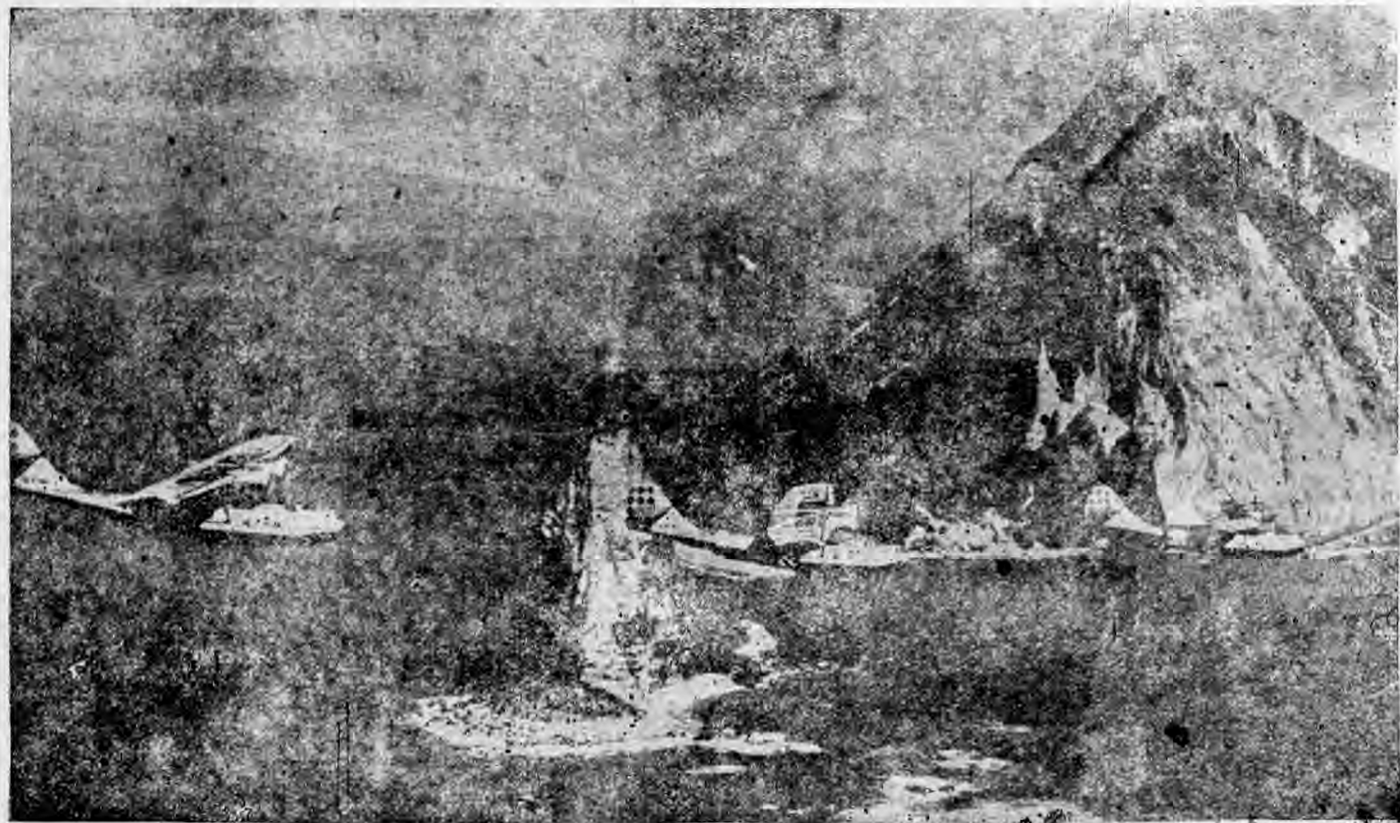
阿斯拉加之美國巡邏地