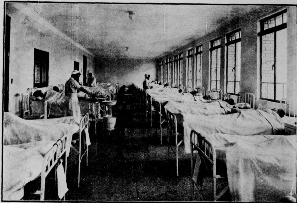
室 病 通 普