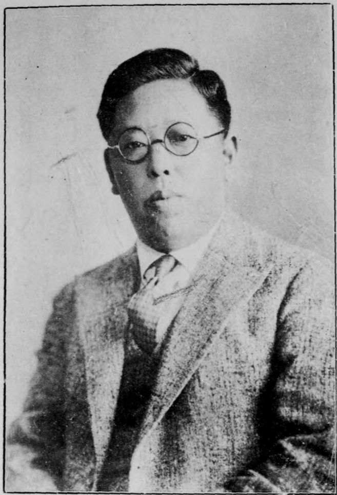
劉 長 院 瑞 恆