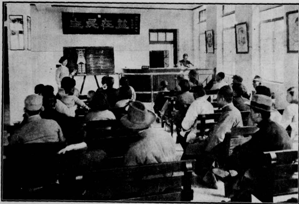
門診部候診時護士講演