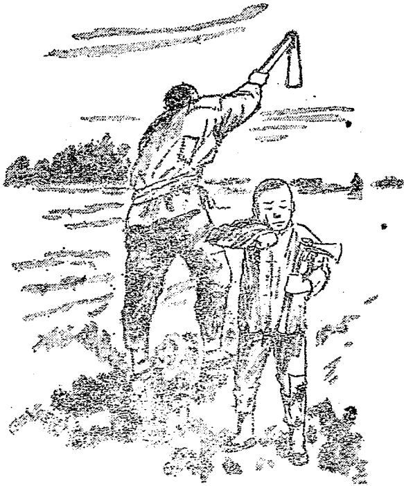
父子兩個都在外邊當僱漢