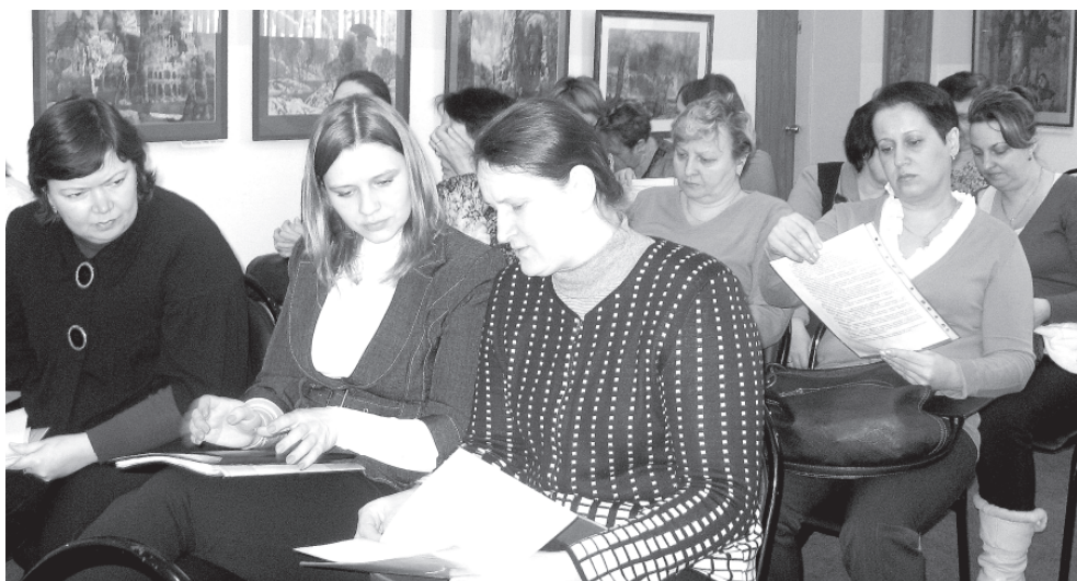
Это они, социальные педагоги, учат детей радоваться и любить, верить в себя.