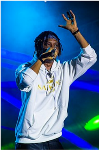
Safarel au FEMUA 15