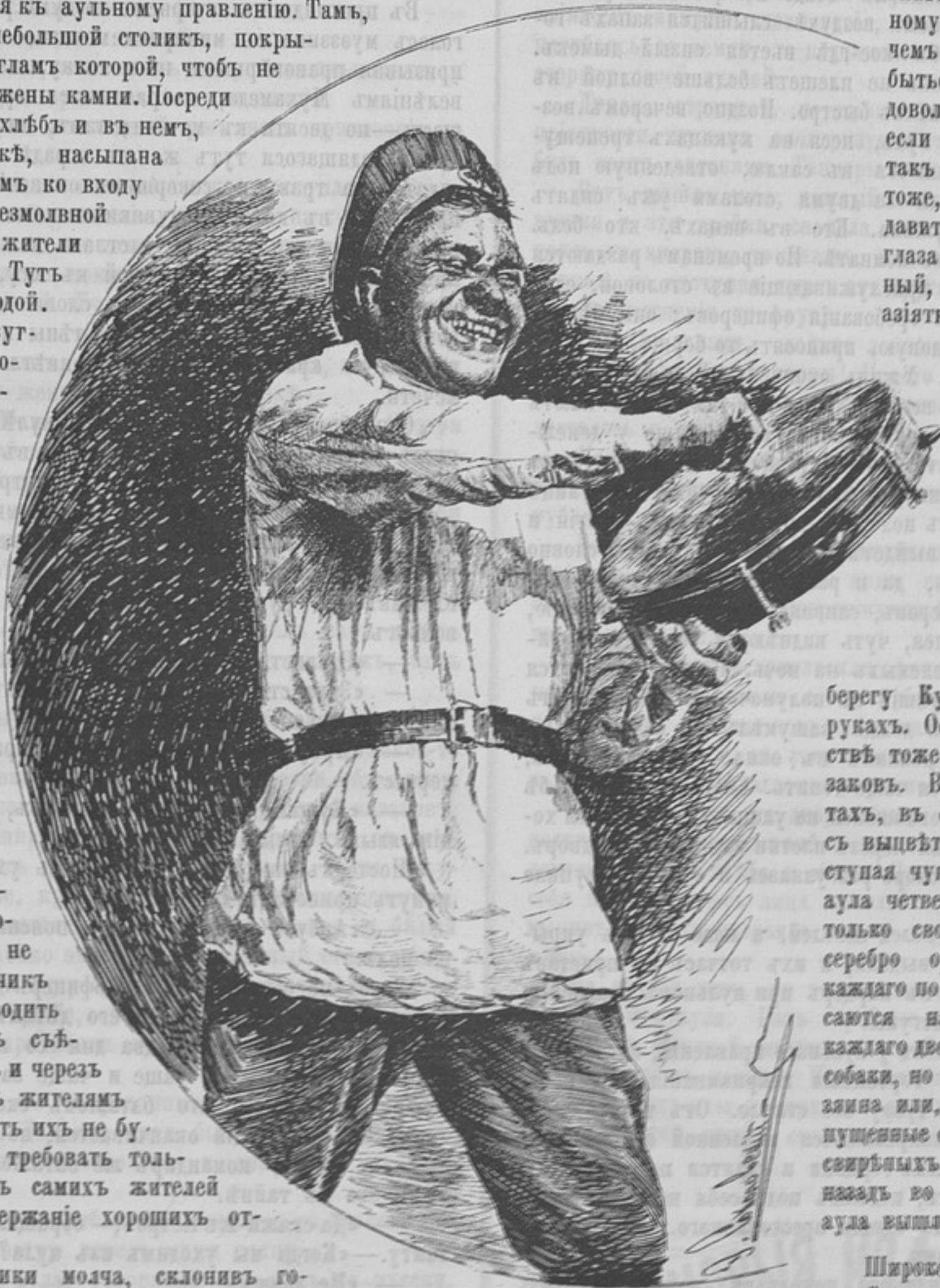
Къ рецензіи сочиненія «Драгуны на трясѣ»

— «Эго сазанъ», — промолвилъ онъ, вываживая рыбу и перебиралъ лѣску руками.