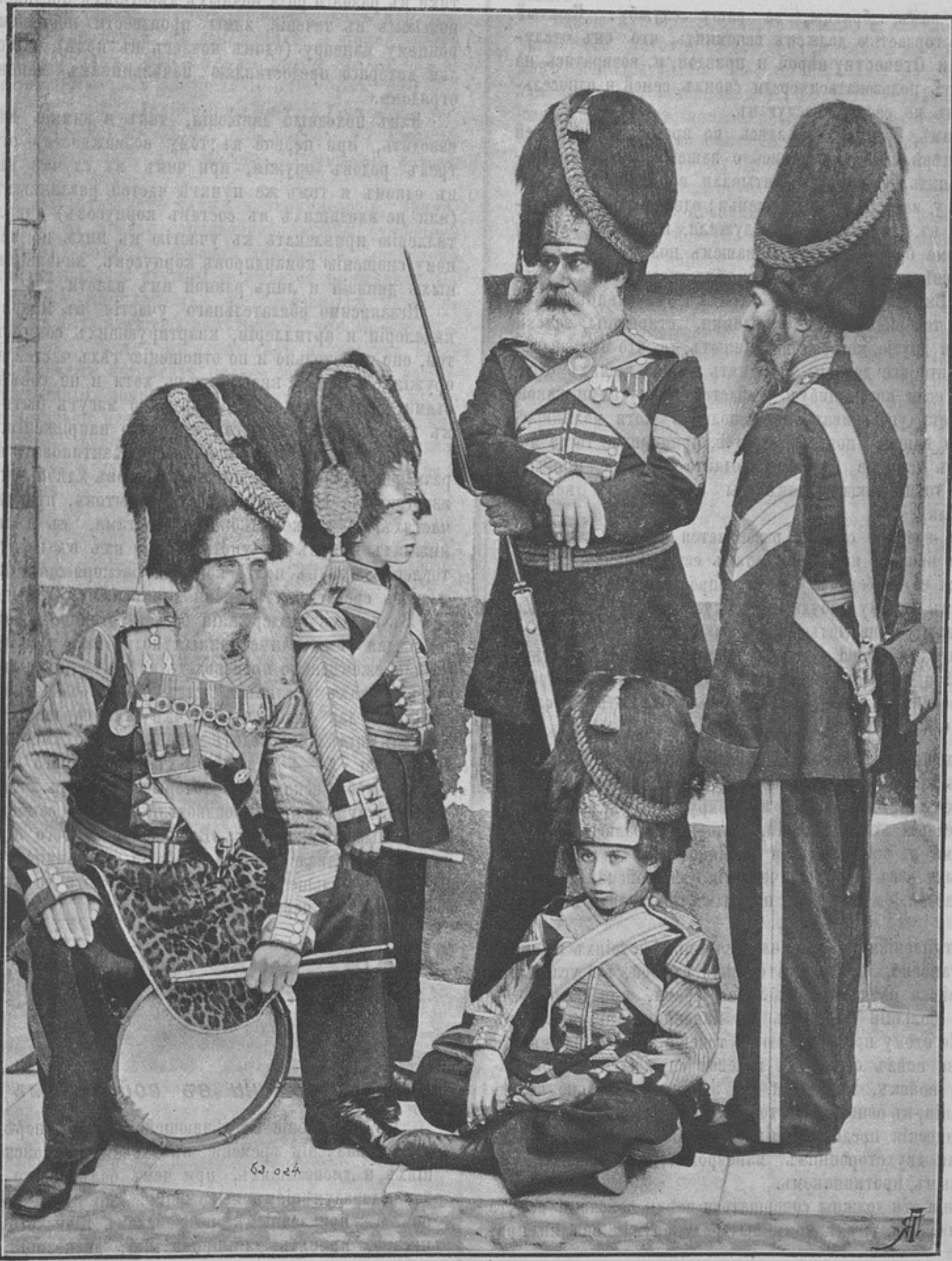
Дворцовые гренадеры, по случаю праздника роты Дворцовыхъ гренадеръ 6 декабря. (Съ фотографіи братьевъ de Jong.)

Годъ VII. Начать съ № 169. —♦— С.-Петербургъ, Колокольная, 14. ♦— Выходить еженедѣльно.