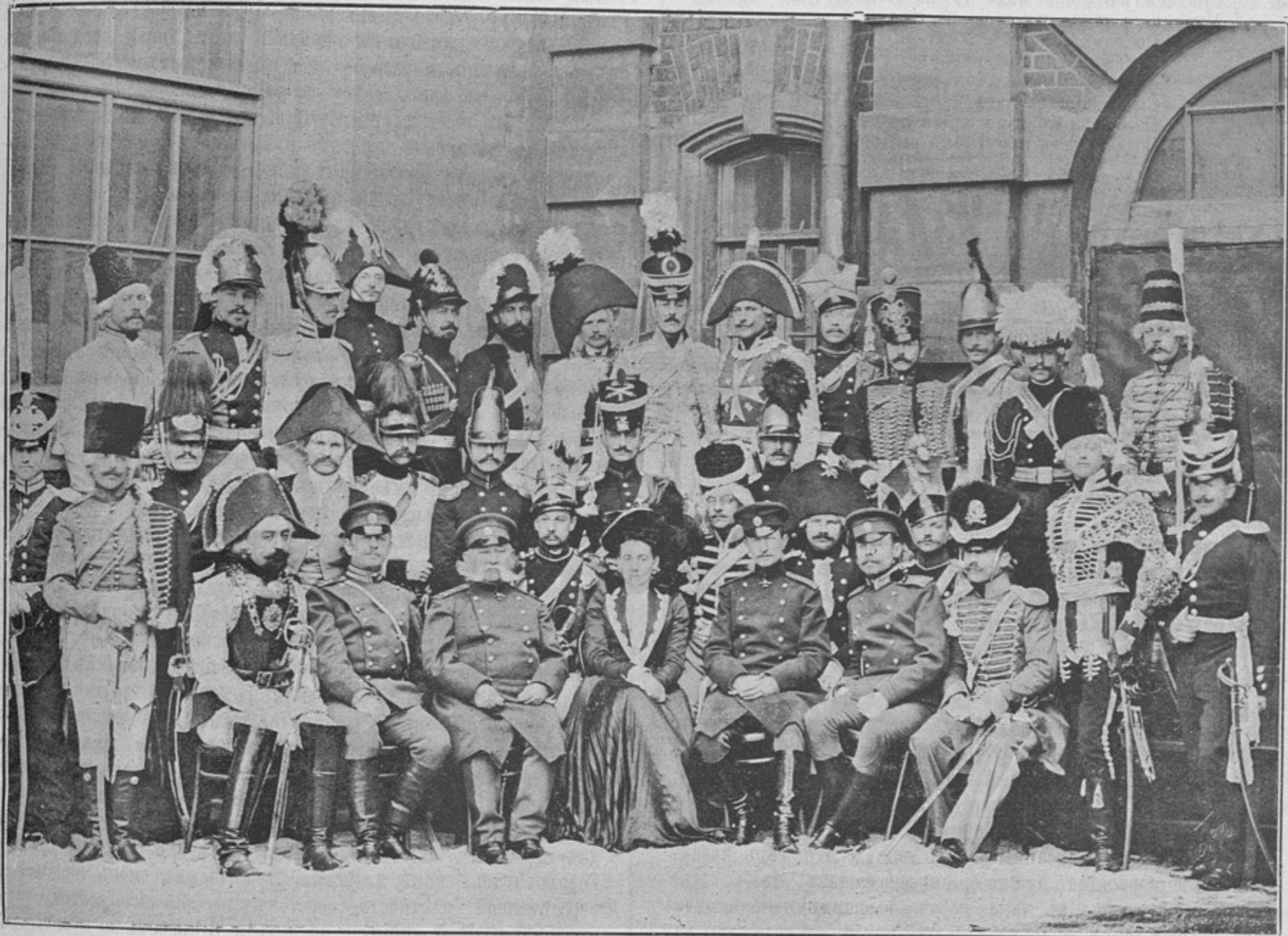
Организаторы и участники исторической военной карусели 28 и 30 марта 1900 года.

Прошло сто лѣтъ... Могучимъ эхомъ Твое откликнулось «ура!» Носители твоихъ завѣтовъ, Глубоко въ сердца ихъ храня, Восторгомъ искреннимъ согрѣты, Стеклися чествовать тебя.