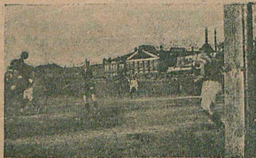
Моментъ игры петроградской команды „Меркурь“ съ Новогиреевскимъ.

Встрѣча закончилась довольно неожиданно: Москва на голову разбила Петроградъ. Новогиреевцы забилы «Меркуру» 6 мячей, а въ свои ворота пропустили лишь одинъ. Общій результатъ—6 : 1 (по хавтаймамъ: 4 : 1 и 2 : 0).