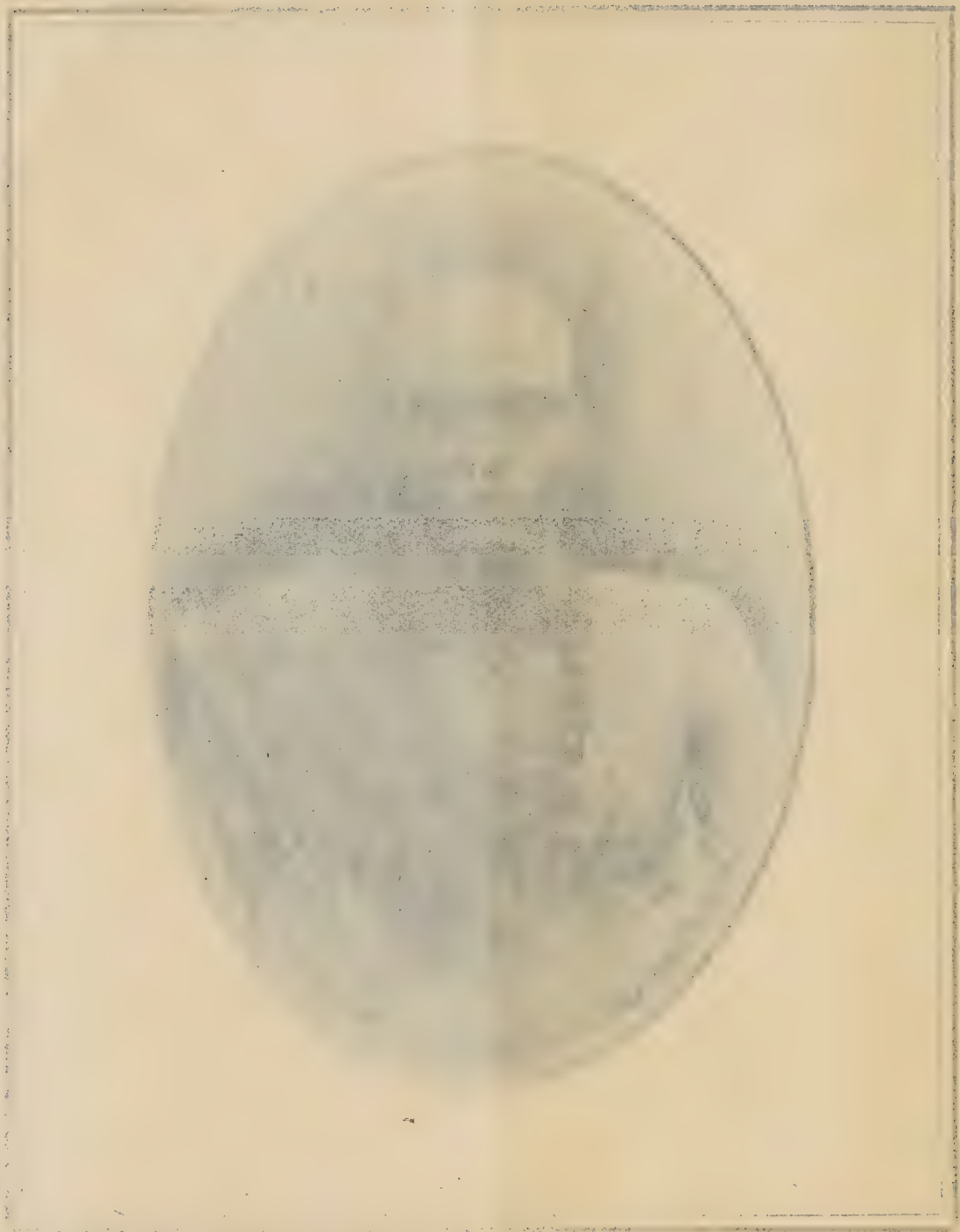
[Faint, illegible text, likely a title or description of the illustration above.]