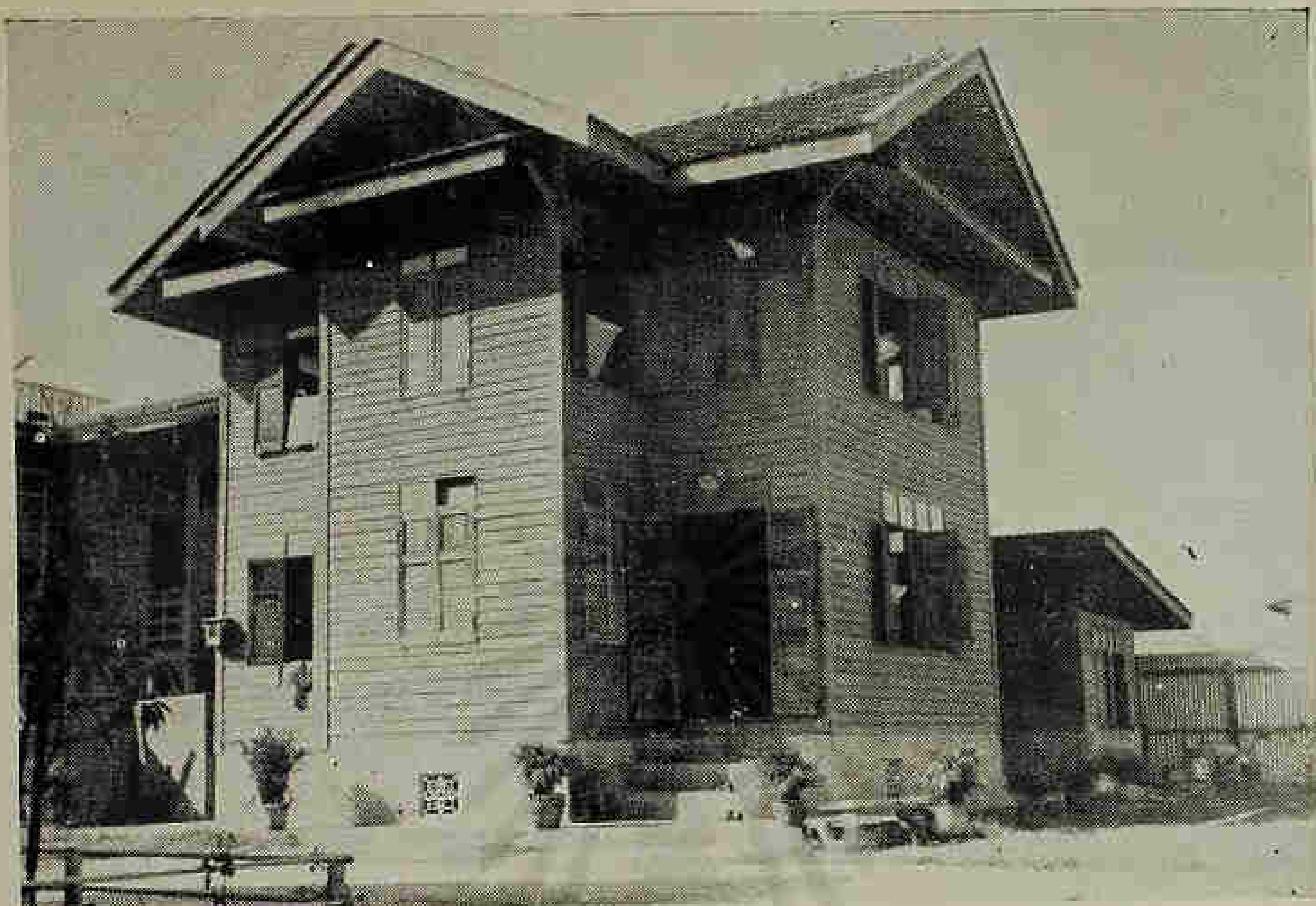
กุฎีศรีอักษร สร้างถวายเมื่อ พ.ศ. ๒๔๕๕