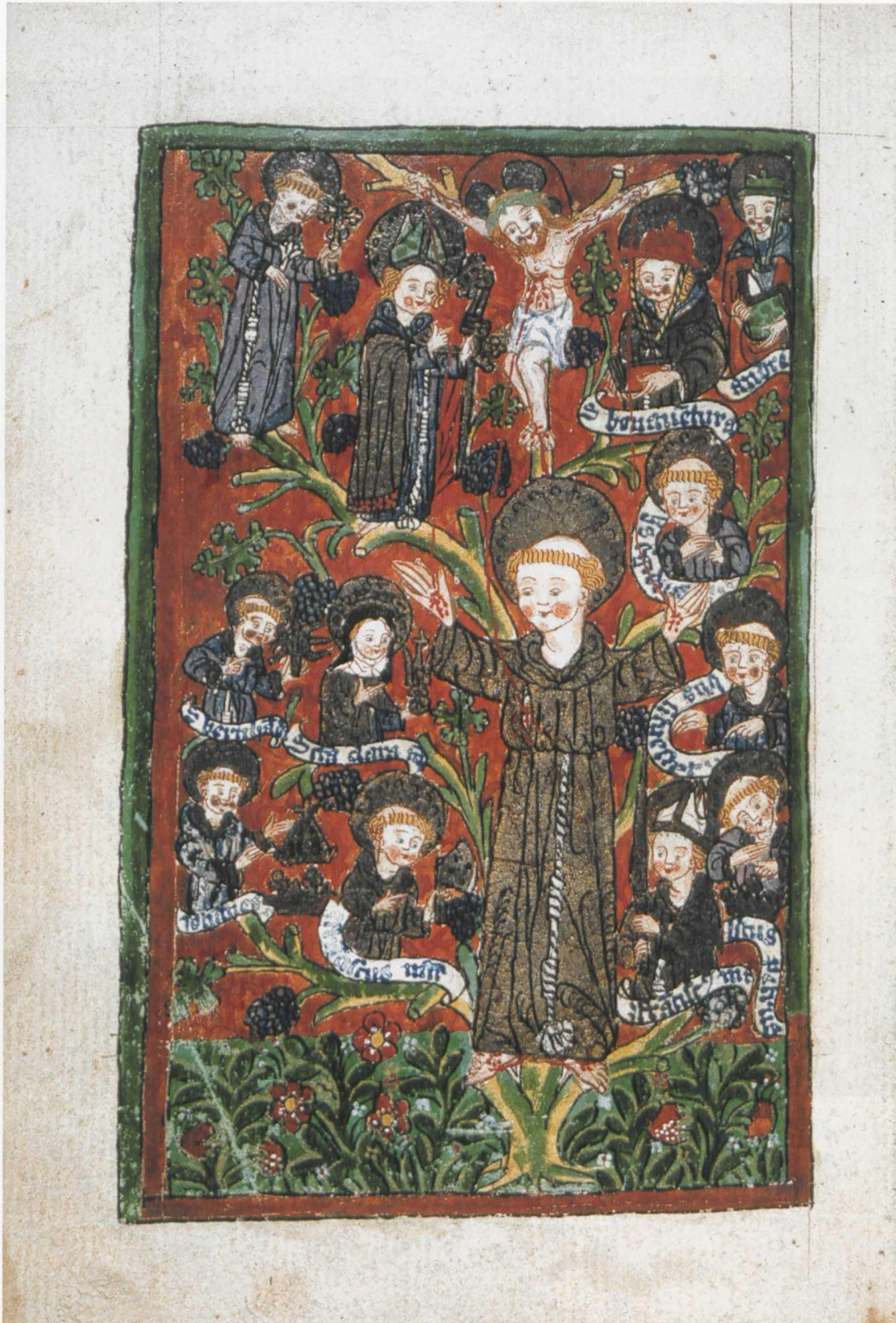
Tafel 21 Franziskusleben, The British Library, London, Add. 15710, fol. 246v: Franziskanerstammbaum, Freiburg, Klarissenkloster: Sibylla von Bondorf, 1478, Deckfarbenmalerei auf Papier, 204 x 143 mm (Foto: The British Library).