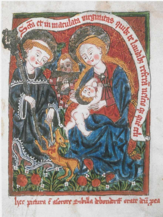
Tafel 18 Klarissenregel, The British Library, London, Add. 15686, fol. 1r: Eingangsbild, Freiburg, Klarissenkloster: Sibylla von Bondorf, wohl 1480, Deckfarbenmalerei auf Pergament, 190 x 147 mm.