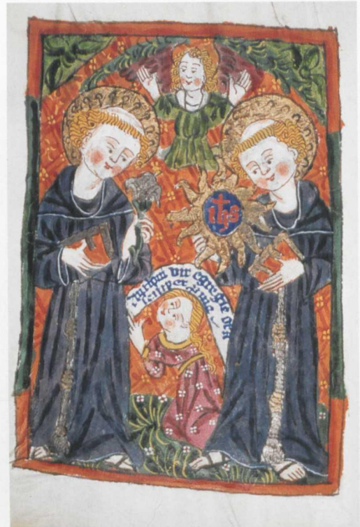
Tafel 19 St. Klara-Buch, Badische Landesbibliothek Karlsruhe, cod. Thennenbach 4, fol. 141v: Antonius von Padua und Bernhardinus von Siena, Straßburg, Klarissenkloster: Sibylla von Bondorf, wohl 1489/90, Deckfarbenmalerei auf Pergament, 155 x 110 mm.