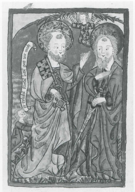
Abb. 2 Franziskusleben, The British Library, London, Add. 15710, fol. 173r: Petrus und Paulus, Freiburg, Klarissenkloster: Sibylla von Bondorf, 1478, Deckfarbenmalerei auf Papier, 204 x 143 mm.