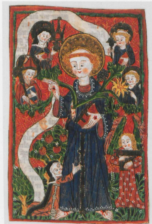
Tafel 20 Fragment eines Franziskuslebens, Staatliche Graphische Sammlung München, Inv. Nr. 39845: Franziskus mit Franziskanerstammbaum, Freiburg, Klarissenkloster (?): Sibylla von Bondorf, nach 1478, Deckfarbenmalerei auf Pergament, 160 x 105 mm (Foto: Staatliche Graphische Sammlung München).