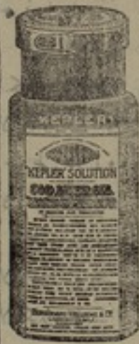
شكله مظهر جيداً

محلول ، كپلار ، يستعمل فائدة كبرى للامهات المرضعات وخاصيته انه يقوى بنيه الام ويساعدها على افراز كمية عظيمة من يترتب على اللبن وذلك نمو الطفل كثيراً .