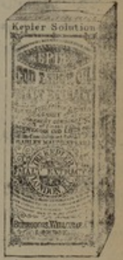
شكله مظهر جيداً

محلول ، كپلار ، ذو طعم شهى كاجود انواع العسل محلول ، كپلار ، يحسن مزجه بالارز واللبن وكثير من الوان الطعام فيصيرها لذينة الطعم مغذية منعشه يمكن الحصول على محلول ، كپلار ، من جميع الاجزاخانات الوكلاء اسطيقان لتج وشركاه .