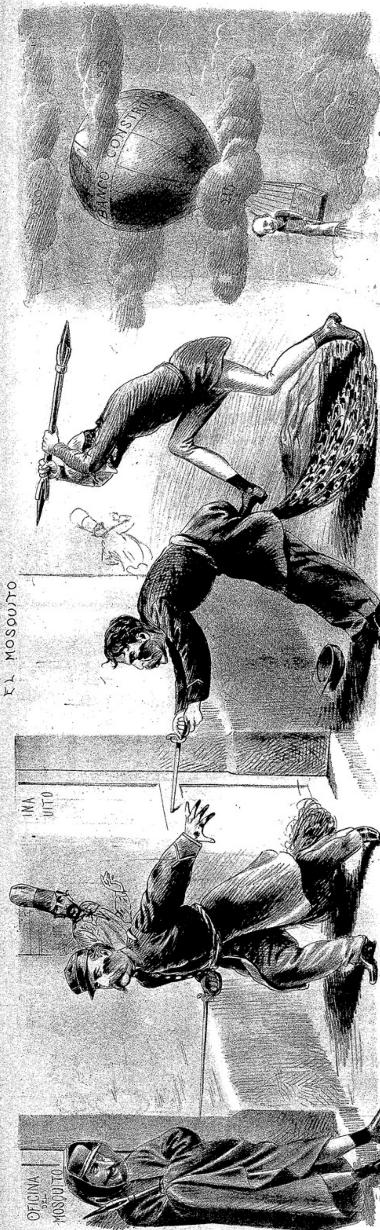
Los últimos ataques contra el MOSQUITO lo dejaron tan SERENO que el D e de la Sabana, creyendo que se dormía, quiso renovar aquella famosa proeza que lo inmortalizó.