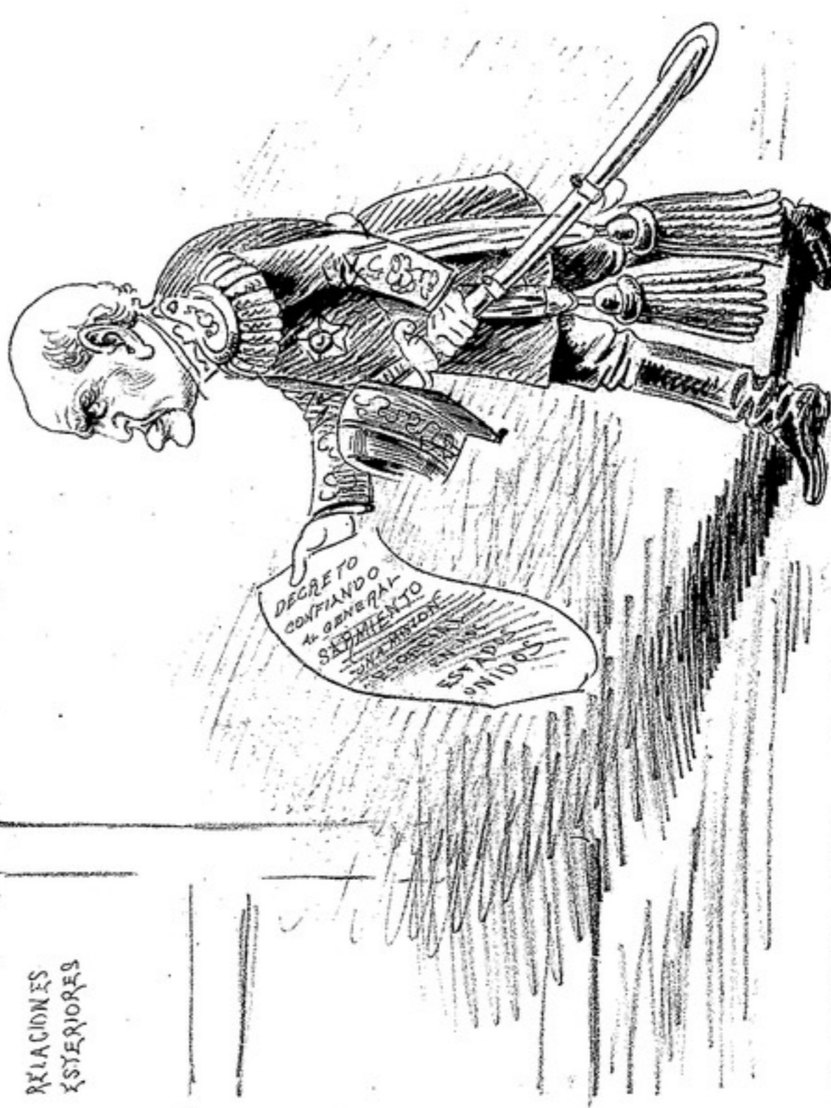
EL VALIENTE GENERAL INDIGNADO DE QUE EL "MOSQUITO" YA NO SE OCUPA MAS DE SU INTERESANTE PERSONALIDAD, QUIERE IR A OPERAR YA A LOS CARGATU-BATISTAS DE NOROCCIDENTAL AMERICA.