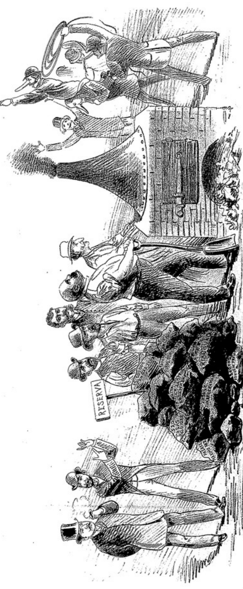
Estoy de acuerdo con V o , amigo Gimenes, está vez el p o lo tiene mucho que y pronto lo veremos pasar por las mismas riberas, más que a los increíbles batistas.