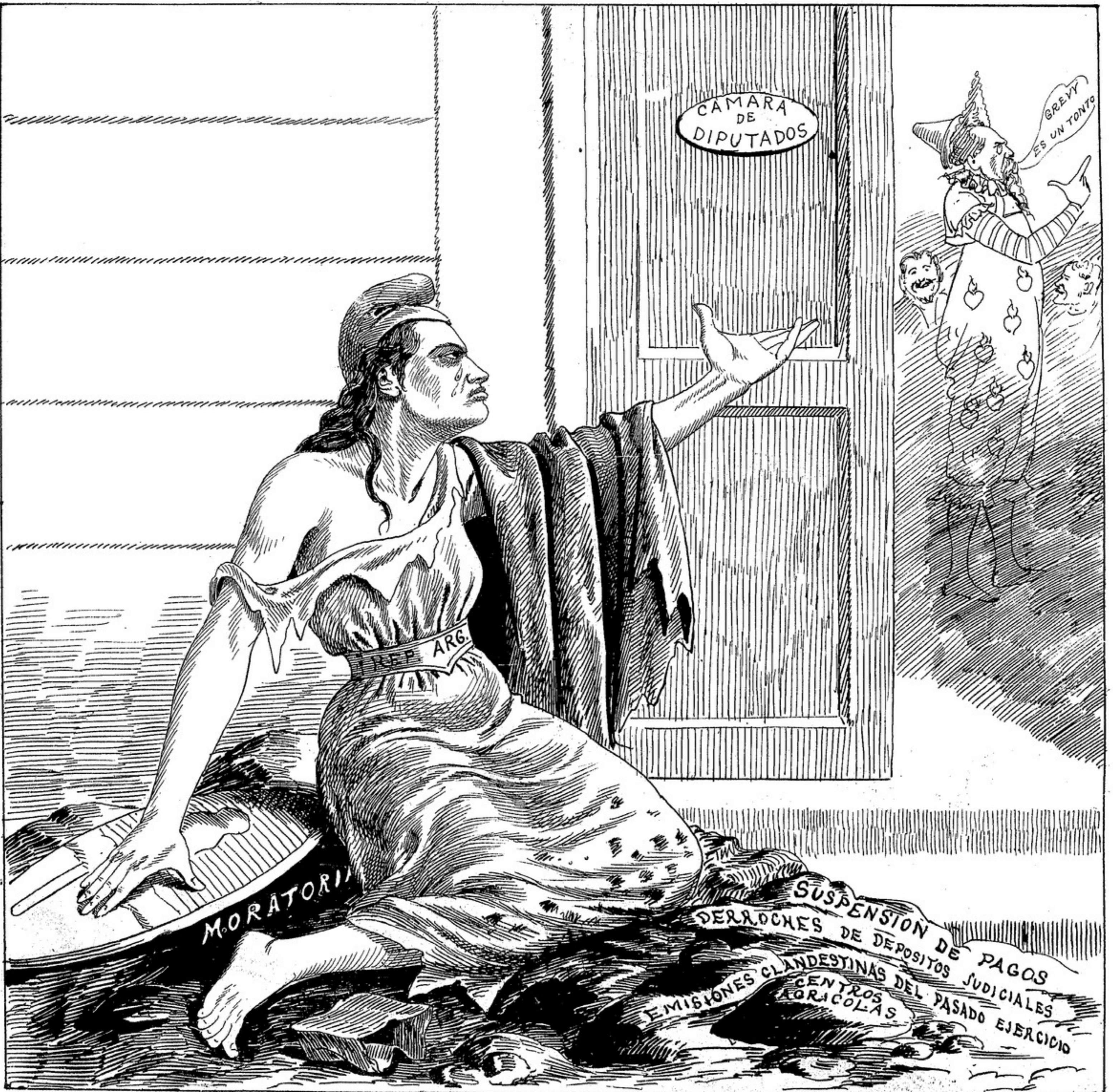
— ¡ Se divierten! se ríen! y yo estoy postrada y agonizando sobre estas inmundicias!