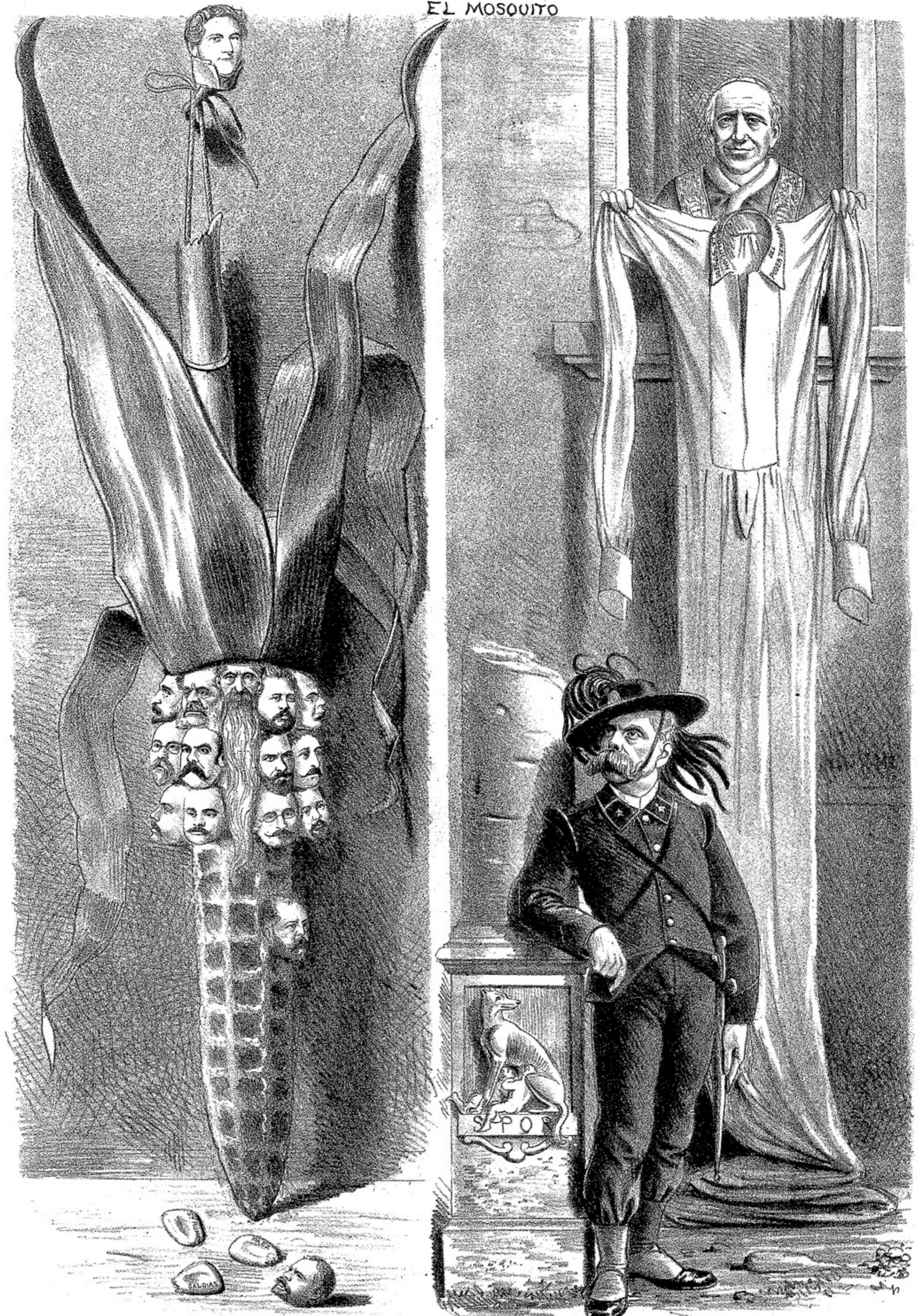
COMO SE DESGRANA LA POBRE MASHORCA.....