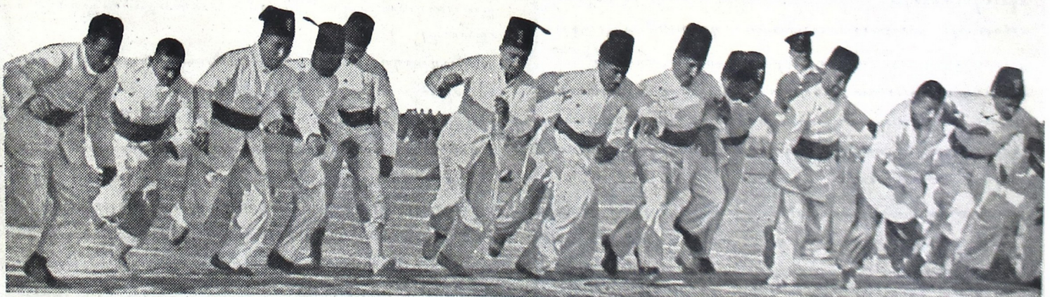
Oelah raga. Wadyabala djoeroe anggegana Inggris ingkang kanggé sawatawis mangsa kapapanaken wonten ing Irak, ngawontenaken oelah raga mladjeng wonten ing saganten wedi kados ing gambar nginggil poenika.