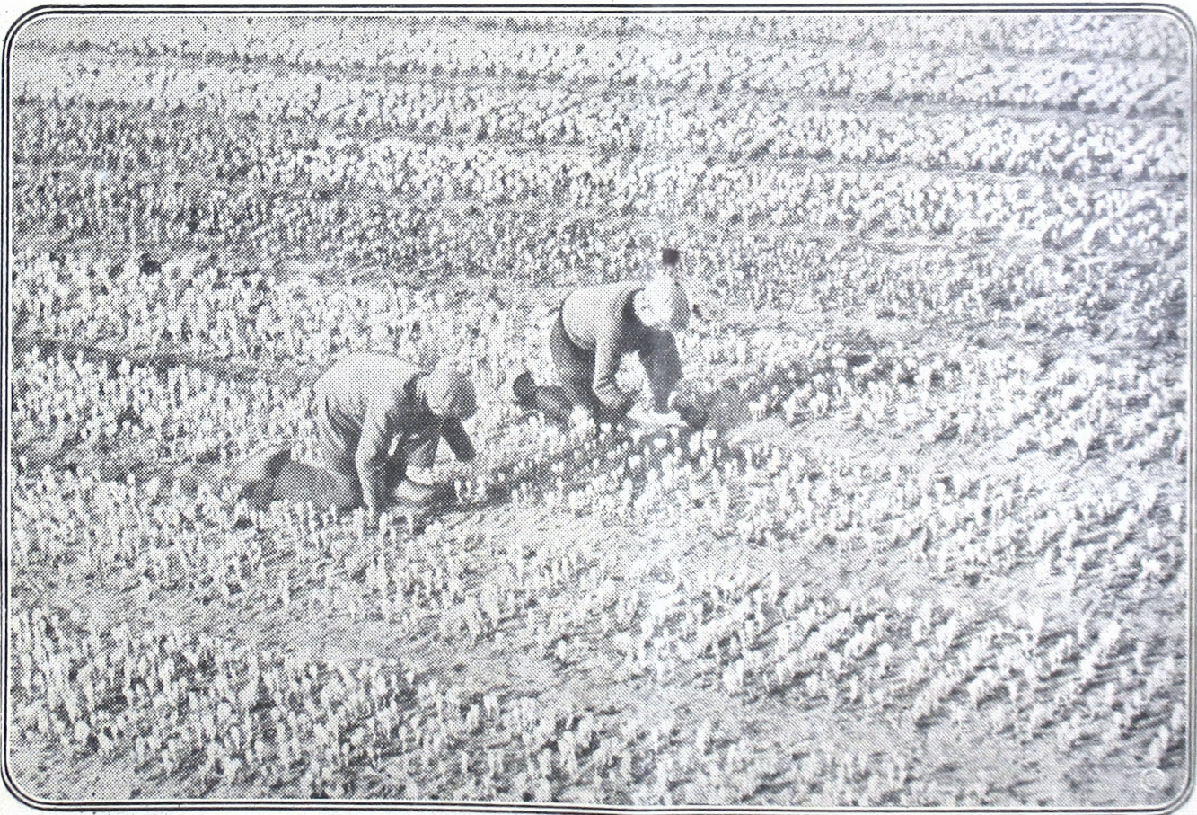
ပုဂံကုမ္ပဏီ၏ ဝယ်ယူမှု အစီအစဉ်များ tulpen ဝယ်ယူမှု အစီအစဉ်များ hyacinthen ဝယ်ယူမှု အစီအစဉ်များ Leiden - Haarlem