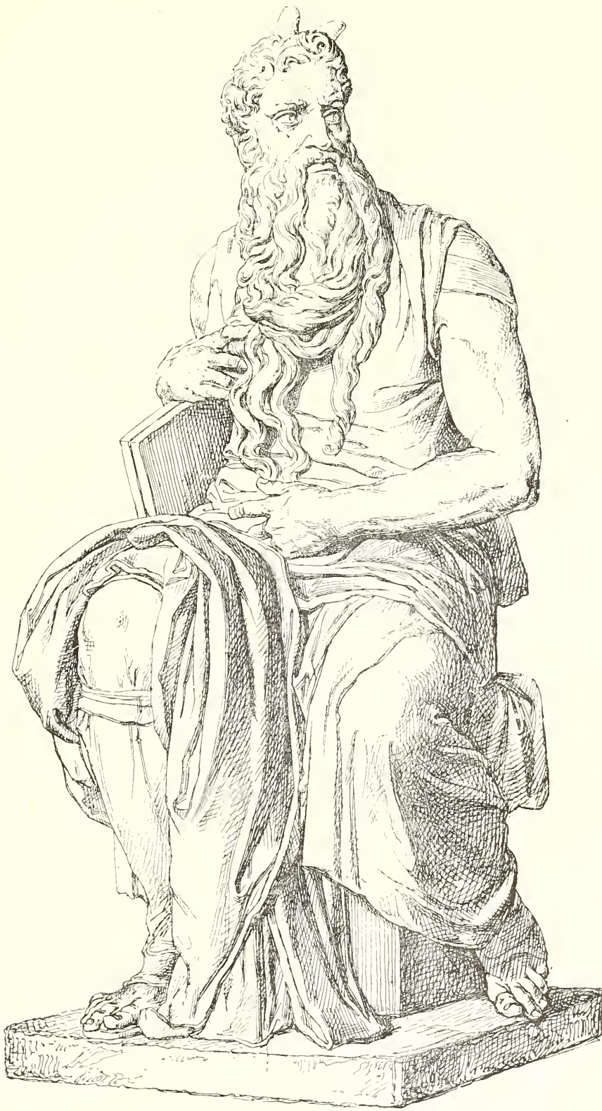
STATUE DE MOÏSE

exécutée par Michel-Ange pour le tombeau de Jules II. (Rome, Saint-Pierre-aux-Liens.)