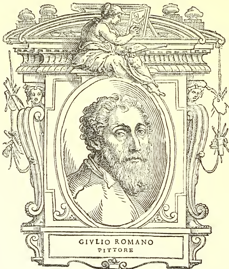
PORTRAIT DE JULES ROMAIN.

Alegrateve che so' za 20 zorni ho mandato via la comare 1 , et son