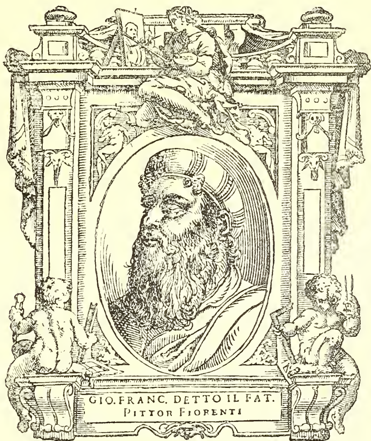
PORTRAIT DE G. FR. PENNI.

n'ai pas votre réponse, quand j'irai trouver le cardinal, il me coupera toujours la parole en me disant qu'il vous écrira et qu'il veut avoir votre avis. Je vous en prie donc, par pitié finissez-en vite, car, tant que je ne serai pas débarrassé de cette affaire, je ne pourrai rien faire de bon; je suis au désespoir, je ne vous dirai pas autre chose. Jésus-