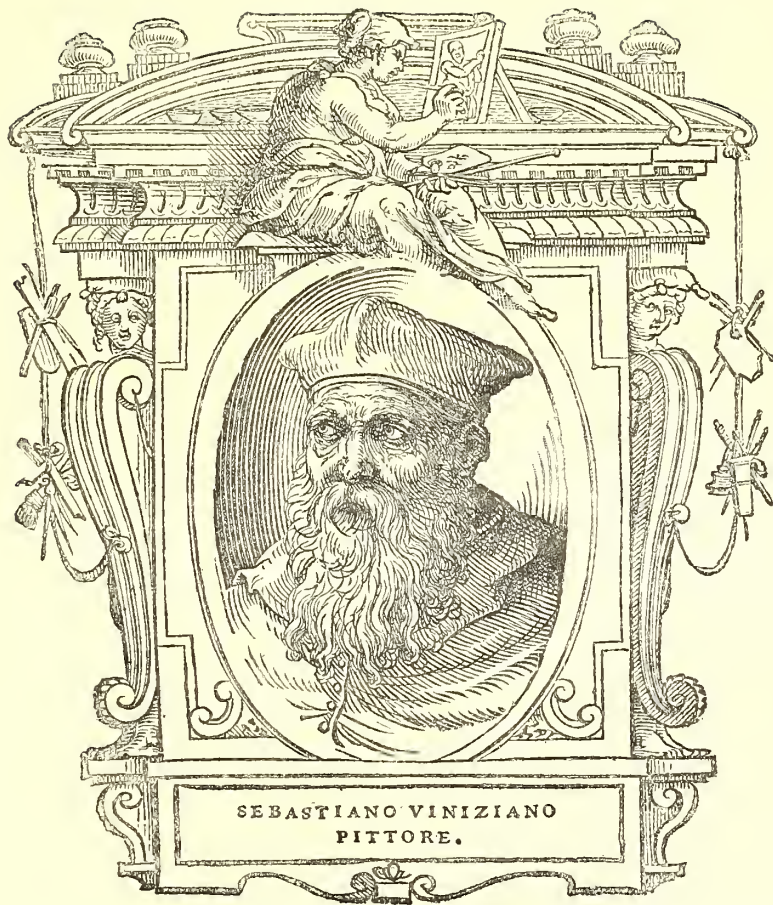
PORTRAIT DE SEBASTIANO DEL PIOMBO, d'après Vasari.