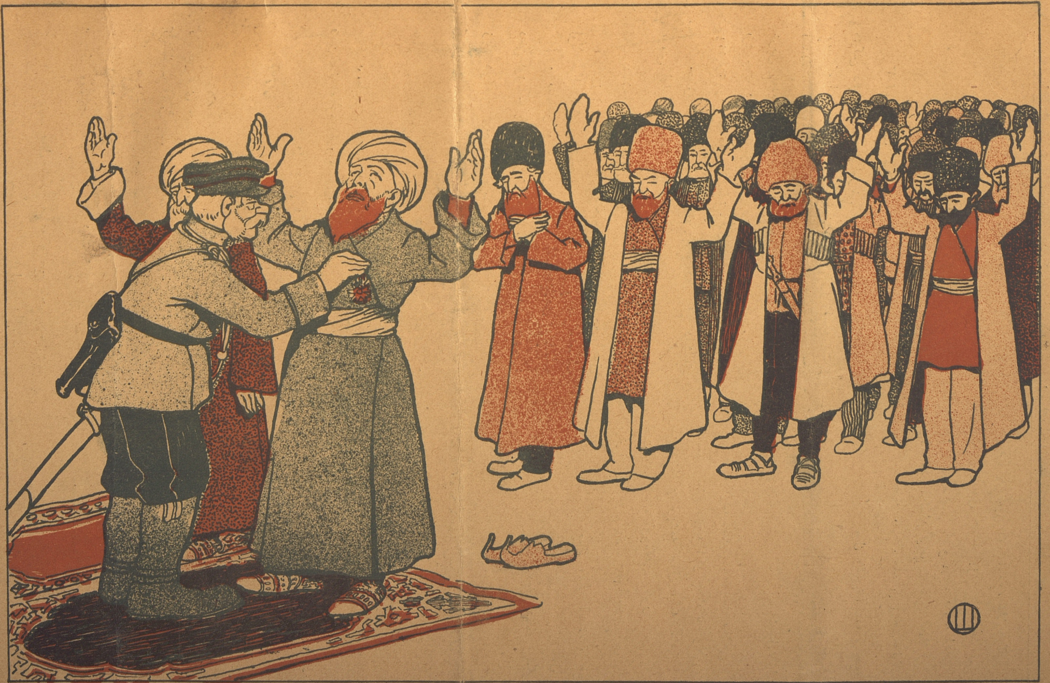
گربه شیر است در گرفتن موش لیکه موش است در مصاف پلنگ .