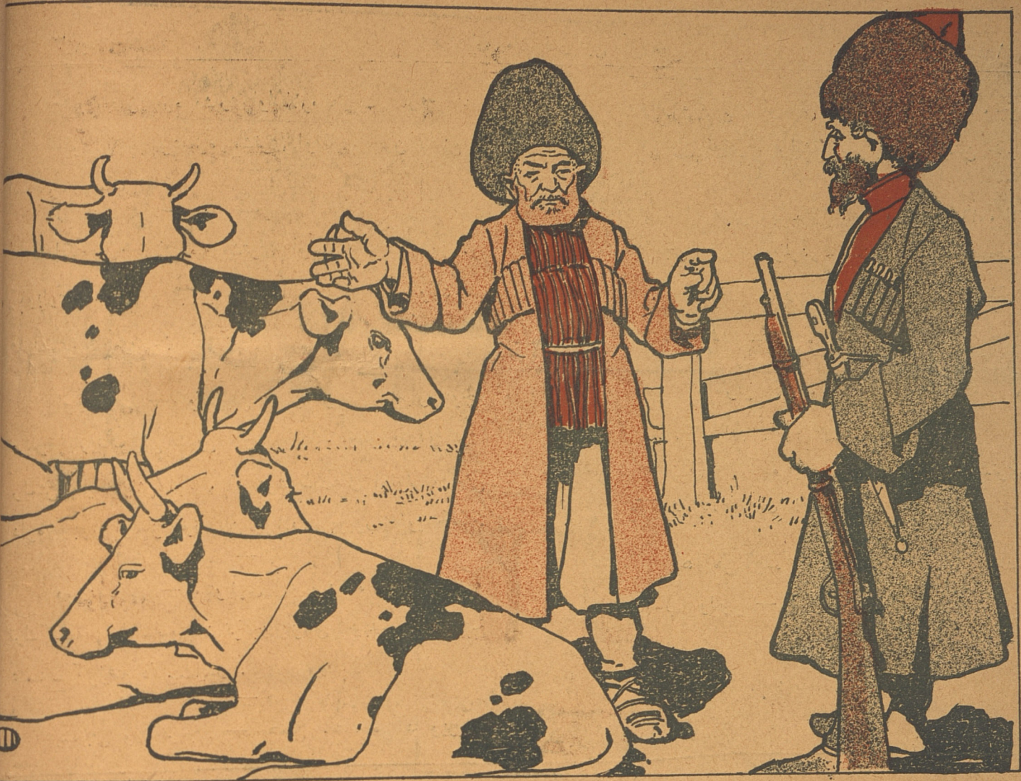
من اولوم گوتور بو حیوانلاری دیر او تفنگی منه