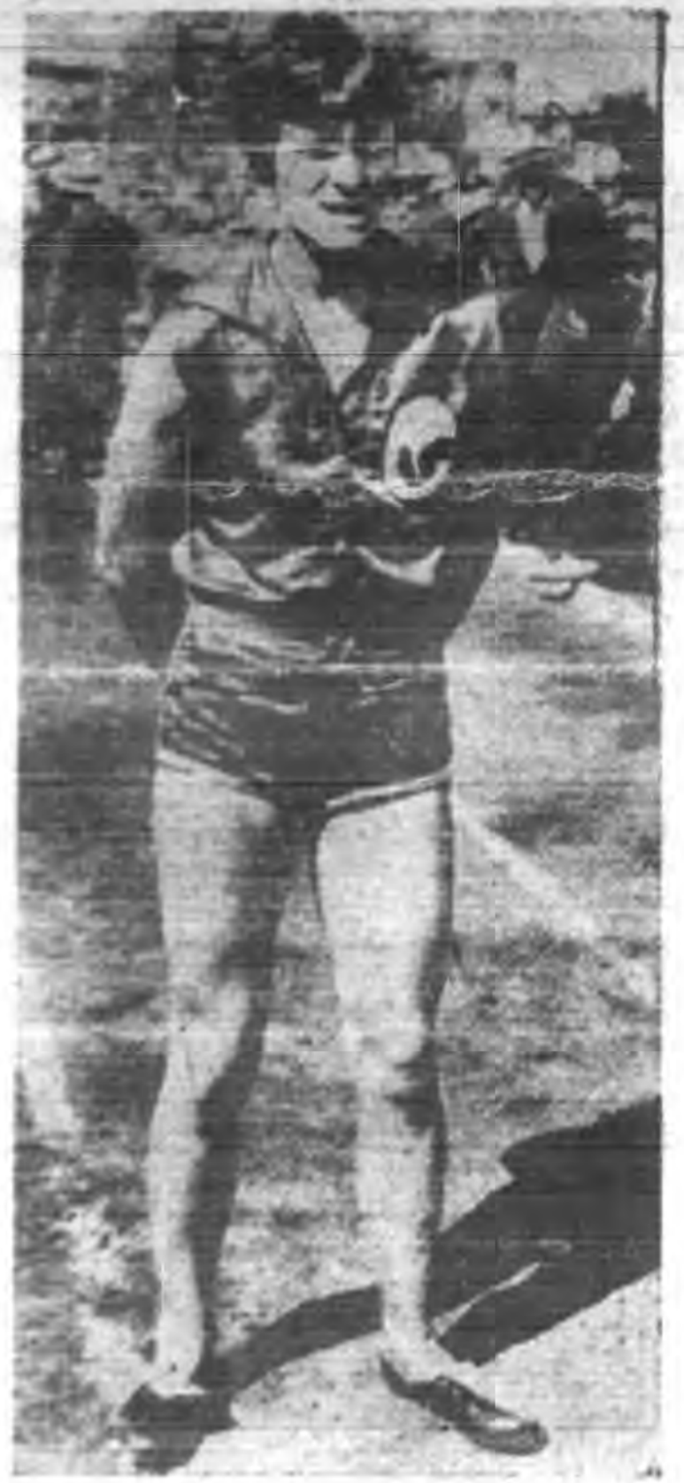
女百米力克遜 軍女士 美冠 國