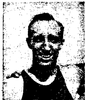
林賽治喬一第欄高

辦，第一為喬治賽林；然其成績，雖較複賽退步十分之二(十四秒六)，但仍然為世界新紀錄(大會紀錄為十四秒八)。