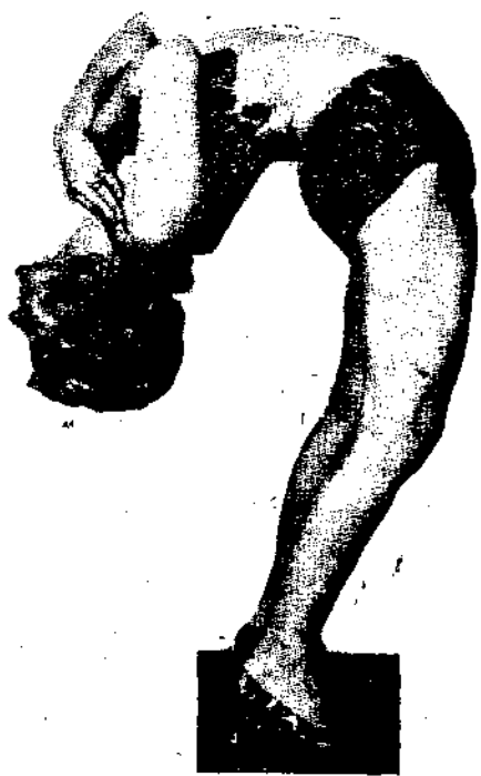
遊回力正軌練習運動竟補醫學之不足 力回天卒成舞蹈名家此其姿勢之一

，亦覺胆怯否？』現在我已年長，不知駭怕，不過彼時我尚年幼，腿疾尚未痊愈，實不能跳。一日我母外出，我住屋內，爬到台階上，距地約計三四呎之多，下面衆小兒看我，吾住下一跳，及至地上，甚為平穩衆小兒的驚訝異常。從前鄰人皆以我為殘弱之小女兒今已完全變為輕捷之身矣。近年來筋骨柔軟，非他人所能及也。