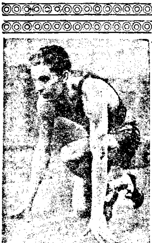
卡廉威之國美一第米百四