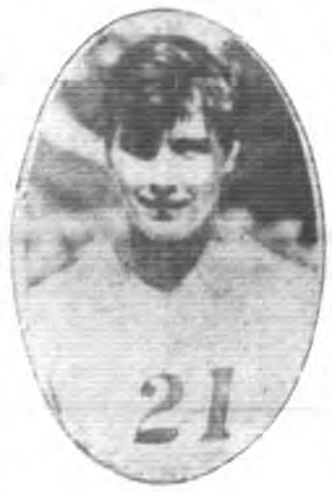
女跳低決賽第二南非友拉克女士