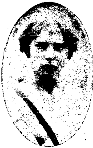
一替演選女士即隊員之一

米冠軍羅濱遜，布列南，華爾特，郝爾，日本又得第五位，其成績為五十二秒二，記錄如下。