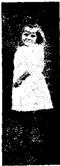
——彎腿成爲殘廢之端妮女士——

所以其相驚奇問我怎能行走？我告訴他們我是職業跳舞家，彼等均不相信；他們又問：我如何練到這種奇異身體？我仍記得，我的小時代的時候，我母親常以當初多年之經驗，告訴我身體如何保護。直到現在吾身體完全強健，將來以救吾之方法，亦可療治受病之小兒。