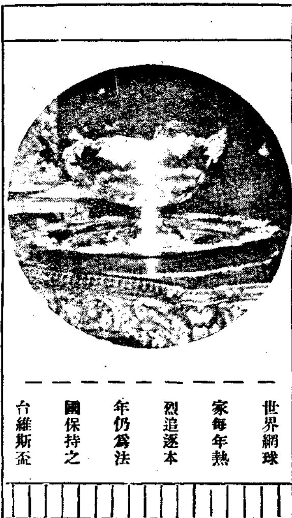
世界網球 家每年熱 烈追逐本 年仍為法 國保持之 台維斯盃

鮑氏勉自振作，恢復三局，至是愛氏以有力之正手抽球，準確之反手抽球制敵，遂以六比三勝第二盤。於是愛氏以二比〇佔先，其勝利，似已成問題，但下三盤球勢突變，第三盤之初，鮑氏球術較為準確，比數達二比二，第五局競爭尤為劇烈，而以三比二佔先；但鮑