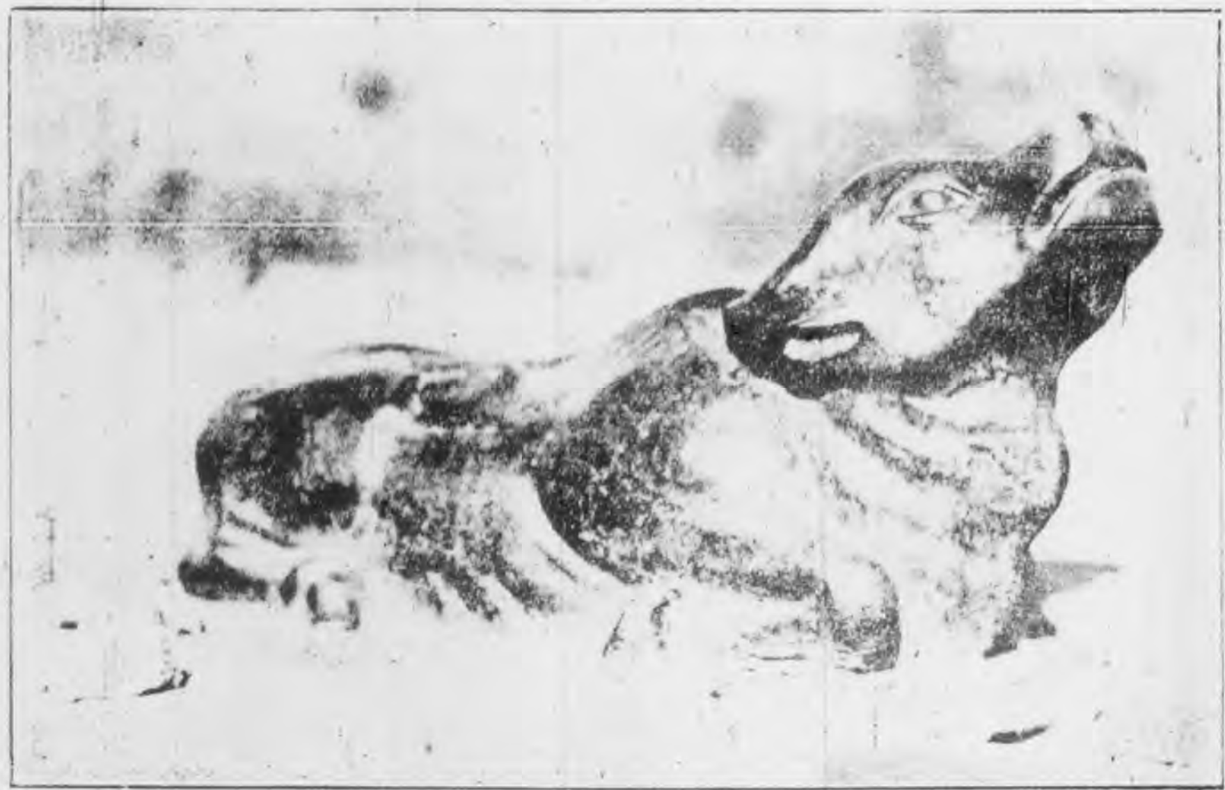
牛 鐵 縣 灘