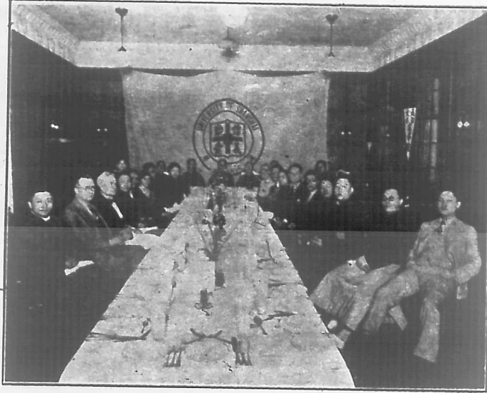
影 攝 會 親 懇