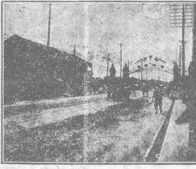
重慶市各界慶祝抗戰勝利大會

滿陽風物，重慶市各界慶祝抗戰勝利大會，場面熱烈，民眾歡欣。大會中，各界代表紛紛發言，表達了對抗戰勝利的喜悅和對建國事業的信心。大會還通過了多項決議，強調了團結合作、共赴國難的重要性。