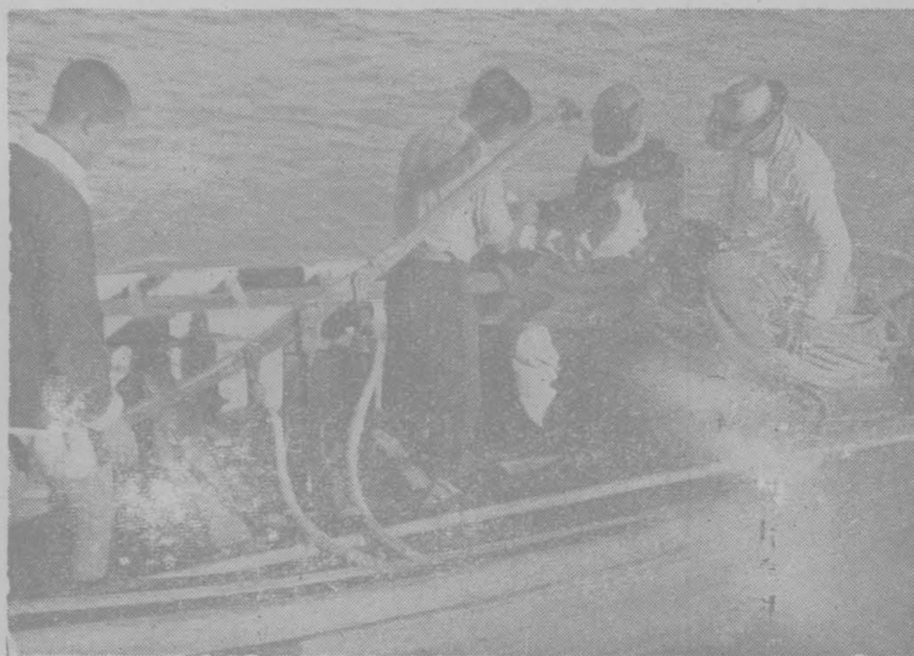
具工之業漁水潛(圖下)