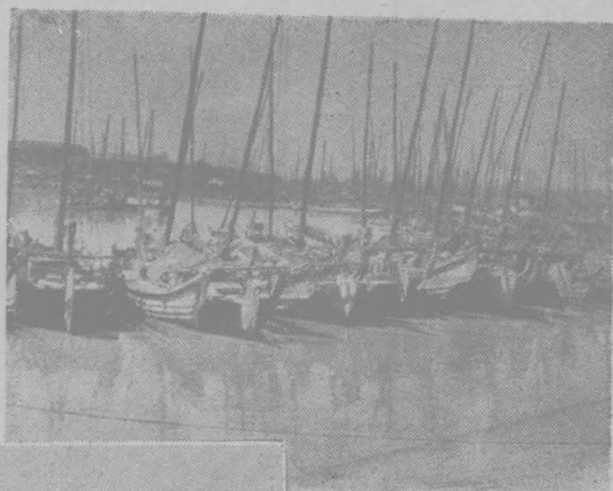
(左) 青島小港中待 發之行總漁船 隊