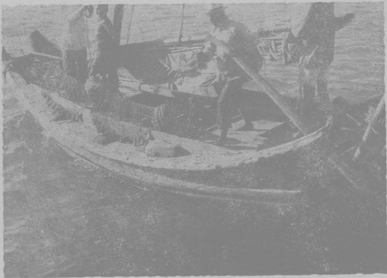
船漁網拉之內灣州膠(圖下)