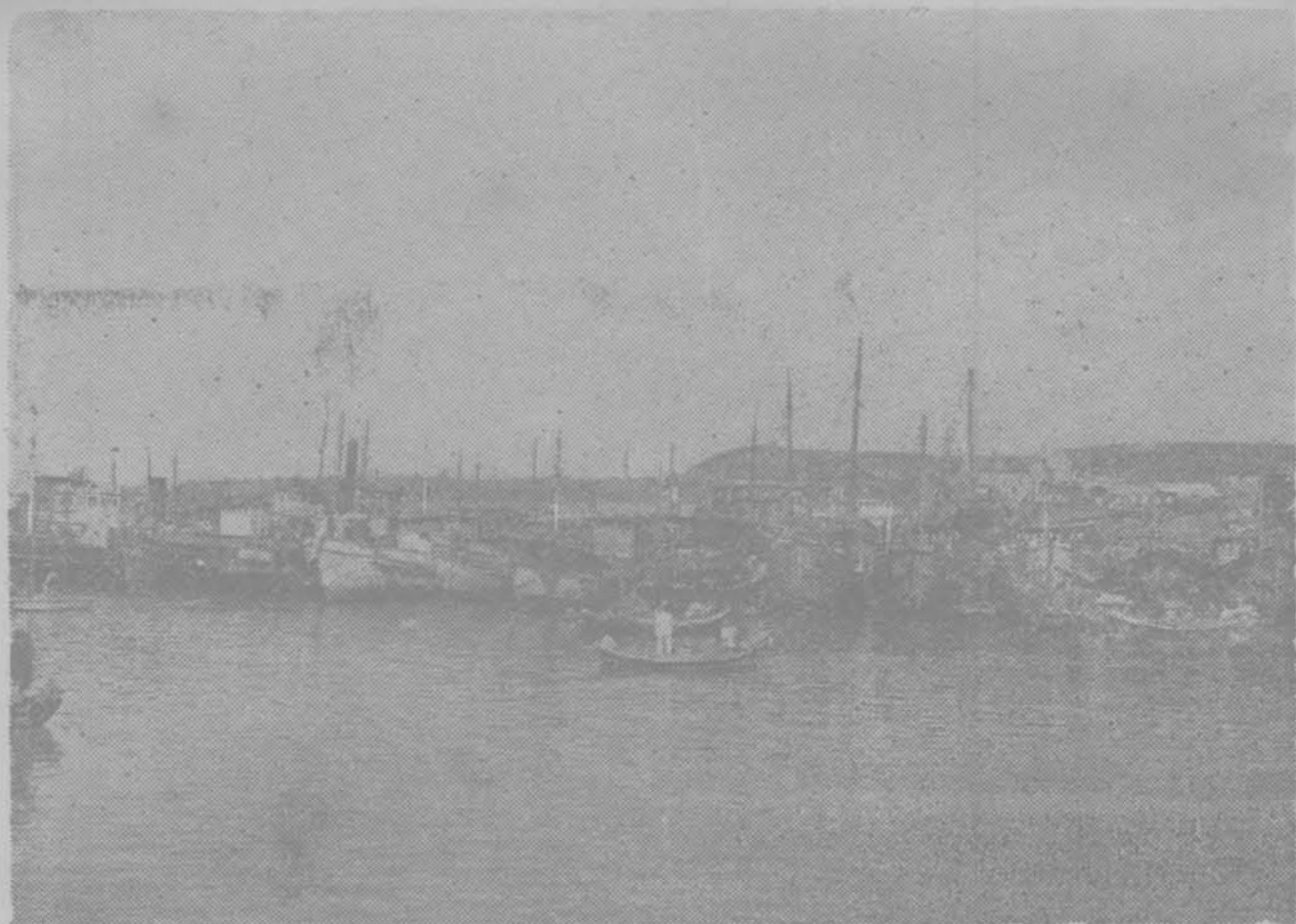
輪漁之泊停中港小島青(圖上)