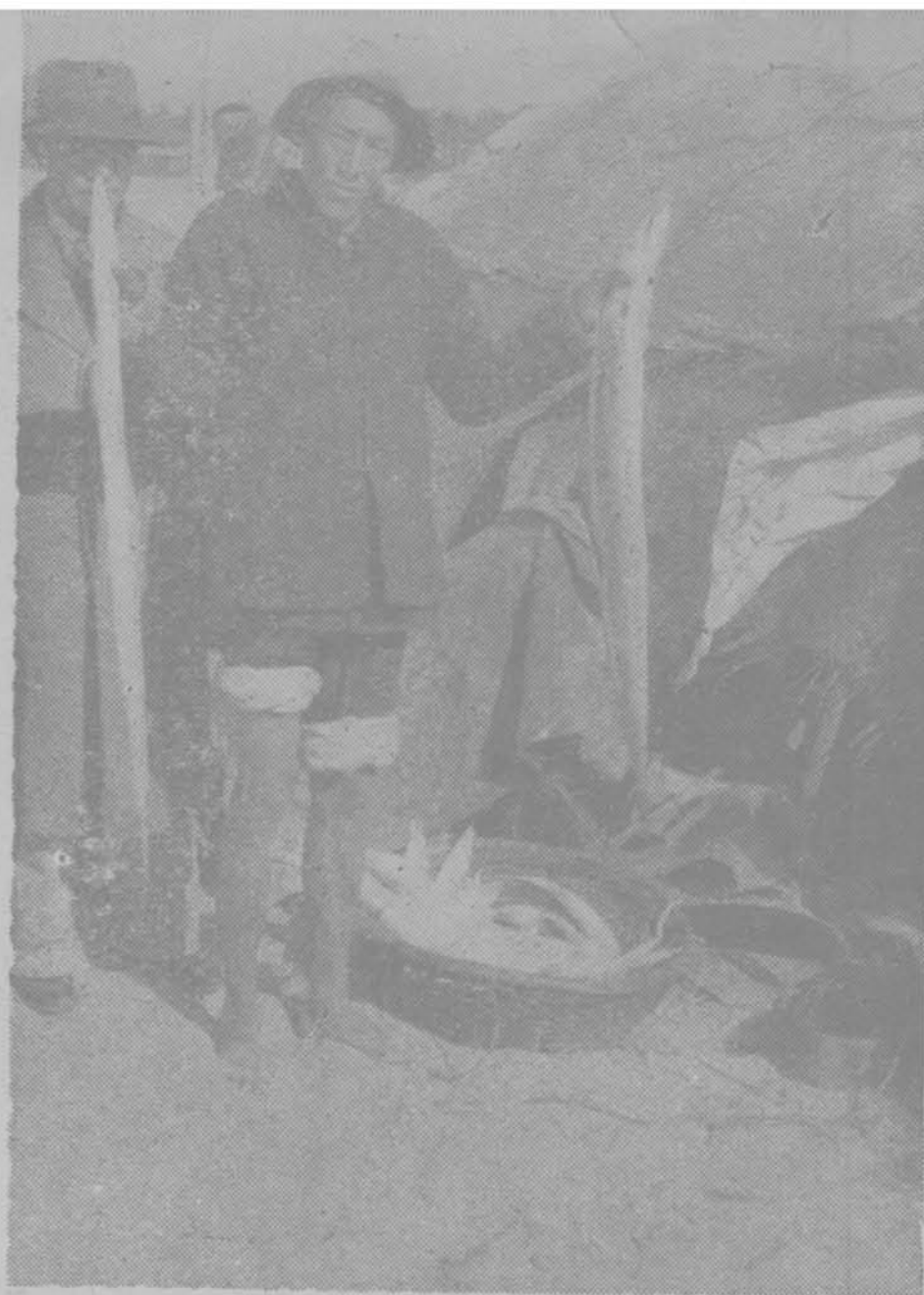
北戴河漁村之臨時房舍