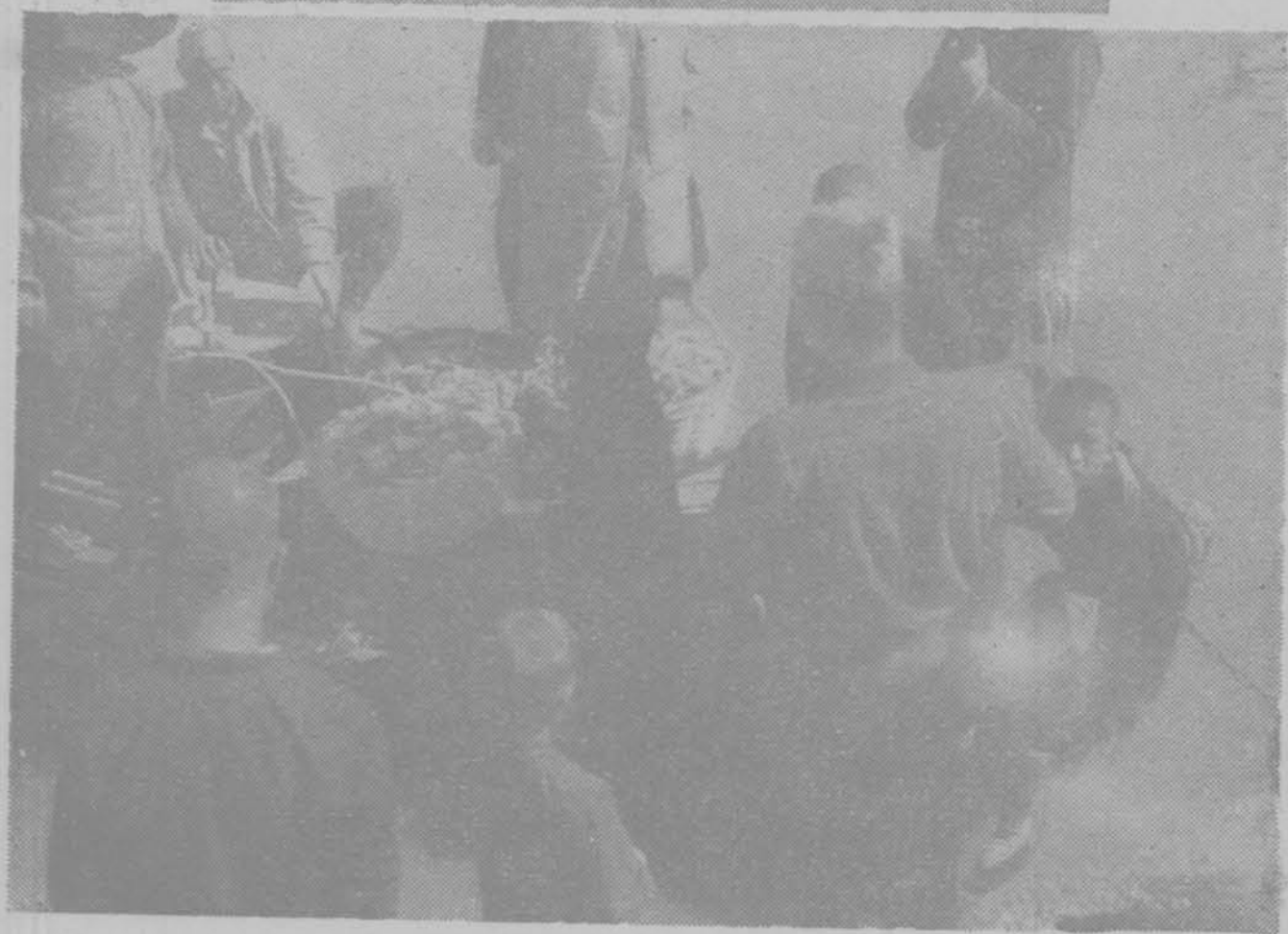
北塘漁船歸港卸魚