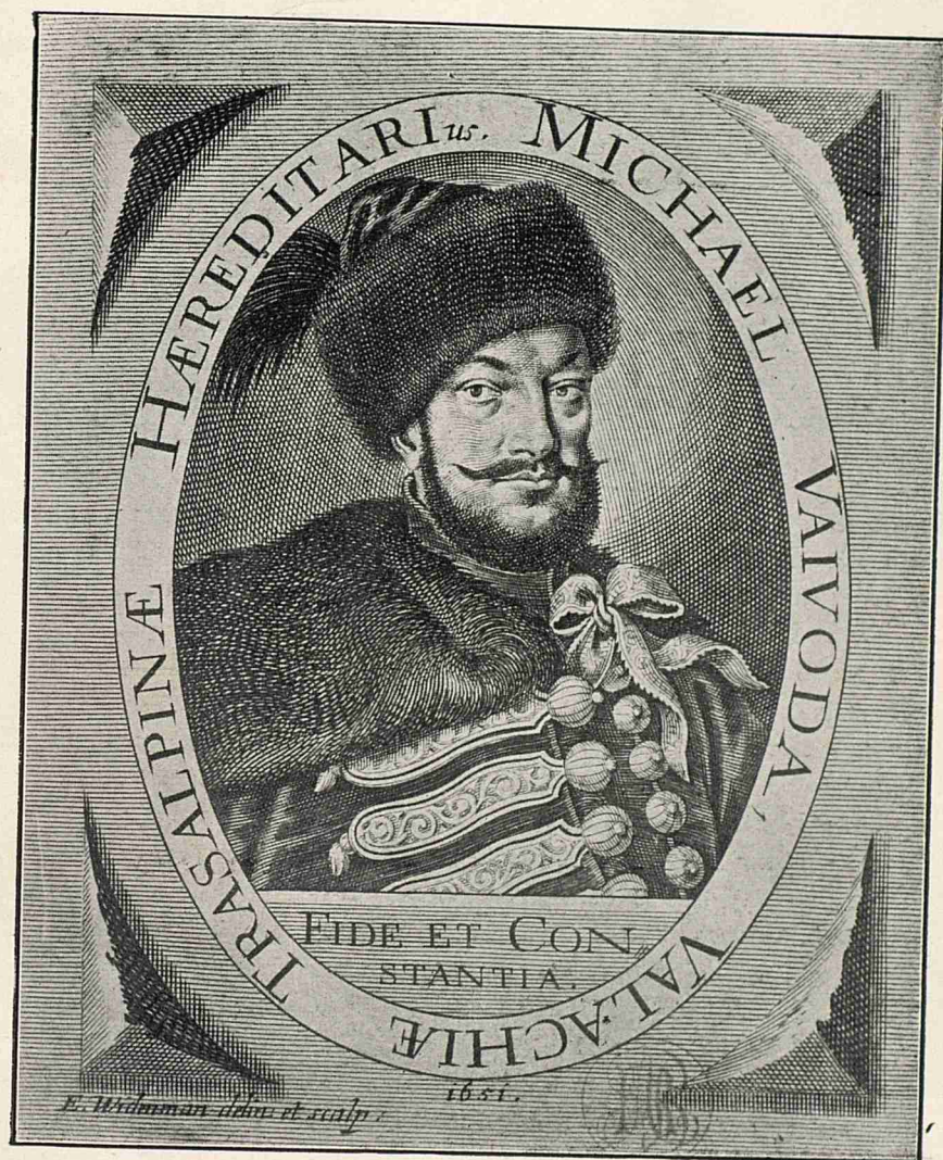
Mihail Radu Voevod (Mihnea)

(După o stampă contemporană, descrisă întâiu de Bălcescu, în Magazinul istoric , V).