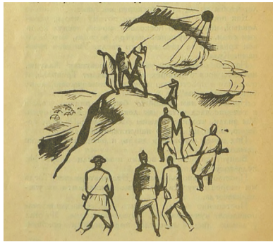
До 100-ліття перемоги отамана Зеленого

Вранці 3 липня 1919 р. Дніпровська флотилія обстріляла Трипіль за гармат, хоч містечко опору не чинило. Після цього гвардія антихриста колонами сторожко вповзла у Трипіль. На вулицях – ні душі. Ніхто не вийшов із хлібом-сіллю. Та завойовники на гостинність і не розраховували. Прагнучи зруйнувати, як вони казали, “бандітське гніздо”, червоні анахтеми почали підпалювати ненависні їм стріхи.