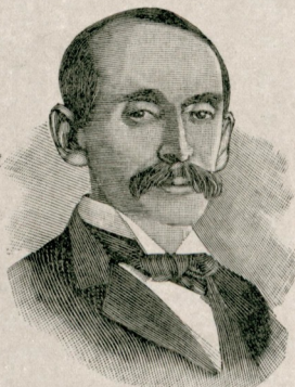
آمریقا خارجه مستشاری [ مستر داوی ]

بورنولی برنجیه به « سن زه لیسک ؟ » دییه صوریه جق اولور ایسه کوزلکندن ، تناسب اندام وخرامندن دیگر ممالک قادییلرینه یکنه مددی فرق ایلمدیکنه عاداتا جانی حیقله رق درشت برچهره ایله : « بورنولی اولدیعی کورمیرمیسک ! » یولنده بر جواب ویرر . قولاندقنلری باشلیجه برلسان اولوب بونک تبولر لسایله بعض مشاهتی وارددر . کانوریلر یکدیگرکدن اوزاقچه کوچک کوچک مسکنلرده اقامت ایدرلر وفلاح و زراعتله مشغول اولورلر . شوعا عربلری ایسه خیمه نشین اوله رق