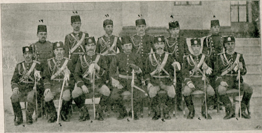
درسمات عشرت مکتبینه وبعده مکتب حربیه وملکیه شاهاندهه اجمال تحصیل ایله یوز باشلیق رتبهسپاه نشأت ایتش وفخری یاوران حضرت شهریارمی سلاک جلیله داخل اولش اولان ضابطانله رتبه رایحه اصحابندن برافندیکن رسملیدرکه مملکتلرینه کیتیمک اوزره ارزنجانه مواصلنارنده مخبرمخصوصمن طرفندن آللوب کوندرلشدنر .