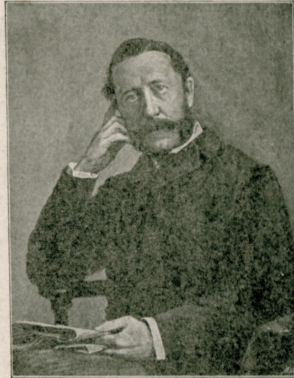
( انکاتره حکومتنک درسمات سفیر جدیدی سیر نیکولا اوقونور جنابلری )