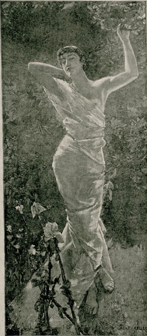
[ نورلر ایچنده ]

بولونویوب بالعکس علوم و فنون منبته حاضرده نک شو محیر العقول ترقیاته سبب اولان اصولی ، اصول تجربیه یی ، تعقیب ایدرک کشف حقایق اغورنده تا بدایتندن مسئله یی تعقیبه باشلامش و بصورتله صنعت حقیقه کی فکریک نصل تحصیل و تشکیل ایتدیکی بزده نقطه نقطه کوسترمشدر . شیمدی بزده بو محترم استاده آدیم آدیم رفاقت ایدرک صنعتک موضوعی و غایه سی نهدر اوکرده تم .