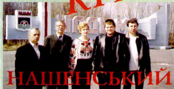
Так склалося моє життя, що ось уже впродовж сімнадцяти років я працюю в далекому заполярному Надмі. Перед тим були пошуки власної дороги в житті, і тут мені допоміг приклад добрих людей.