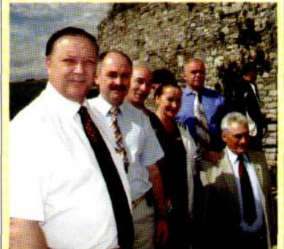
Під дерев'яною стіною Кам'янець-Подільської фортеці.

Але тим не менше нині нам просто повелось на зустрічі з новими ініціативними керівниками та простими людьми Подільського краю. Ми пройшли кілька районів, розпочали візит із зустрічі з кількома заступниками голови облдержадміністрації, які ознайомили нас із багатющою історією свого краю, з етатом нинішніх справ. Далі були відвідини Кам'яниці Подільського з його неповторною фортецею, цікава зустріч із міським головою, якого люди обрали вже вчетверте, що свідчить про його високий авторитет.