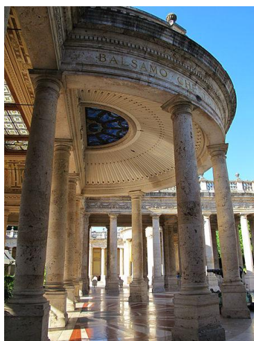
Terme di Tetrucchio, foto