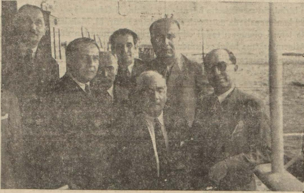
Tevfik RÜŞTÜ bey vapurda selâmetliyenler arasında

«Türkiye cumhuriyeti, Milletler cemiyeti meclisi gayri daimî âza- lığına namzetliğini koymuştur. Türkiyenin on senedenberi sulh yolunda yaptığı gayretler malûm- dur. Bircümle devletlerle ve has- saten komşularımızla olan münâ- sebetlerimiz gayet iyidir. Emeli- miz meclis dahilinde de aynı gay- ret ve mesaimize devam eyle- mektedir.»