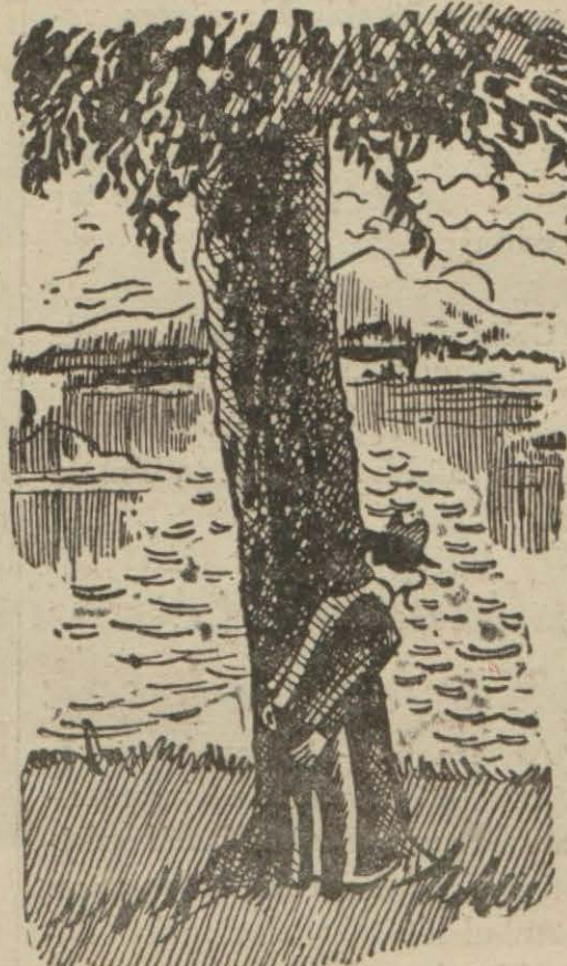
Polis hafiyesi gurubu seyrediyor... İngiliz karikatürü

Haber aldığımız göre, muhte- rem başvekilimize çok parlak bir istikbal merasimi yapılacaktır.»