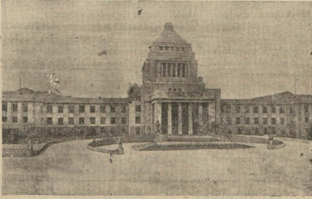
Tokyoda Japon harbiye nezareti binası

Japon hariciye nezareti bundan bir kaç gün sonra bir tebliğ neşrederek şarkî Çin şimendifer hatının alınması için Sovyet hükümetine yapılan müzakereleri hü-