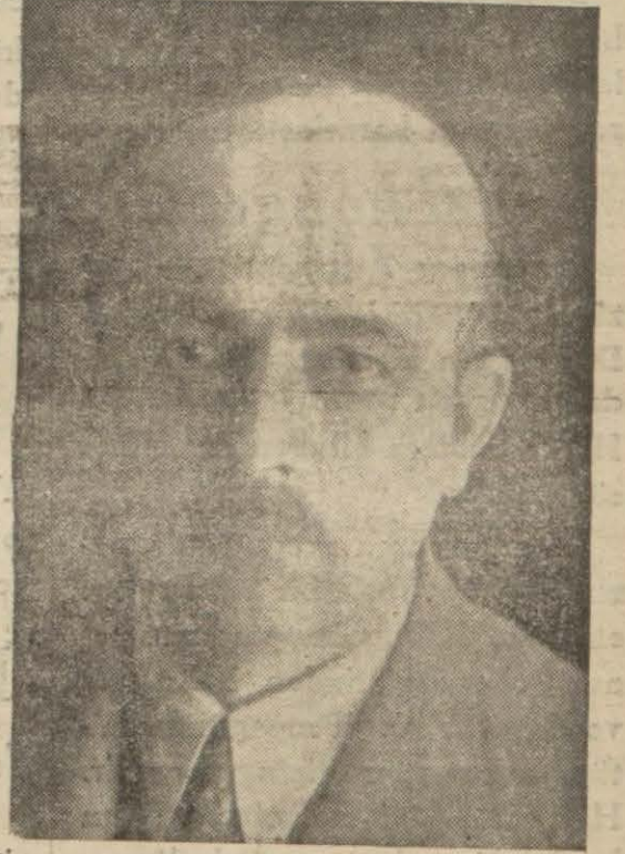
Yakup Kadri bey

Bu tezde bizim noktai nazari- miz, ne Rusyada ve ne de diğer Avrupa memleketlerinde bu za- manın yeni zihniyetini temsil eden bir edebiyatın henüz mevcut olma- dığı merkezinde idi. Bunu da pek tabii buluyorduk. Çünkü kültür