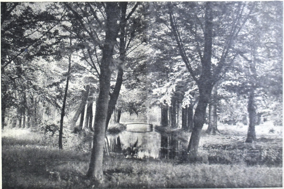
အောက်လူ့အဖွဲ့အစည်း၏အဖွဲ့အစည်း Ockenburg အောက်လူ့အဖွဲ့အစည်း