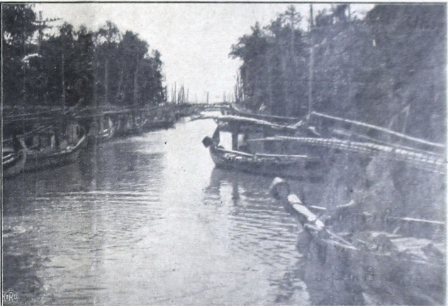
ပုလဲမြစ်ကမ်းခြေ၊ မြောက်ပိုင်း

ရံဝင်ပိုင်ပိုင်... စတင်သောစာအုပ် ရံဝင်ပိုင်ပိုင်... စတင်သောစာအုပ် ရံဝင်ပိုင်ပိုင်... စတင်သောစာအုပ်