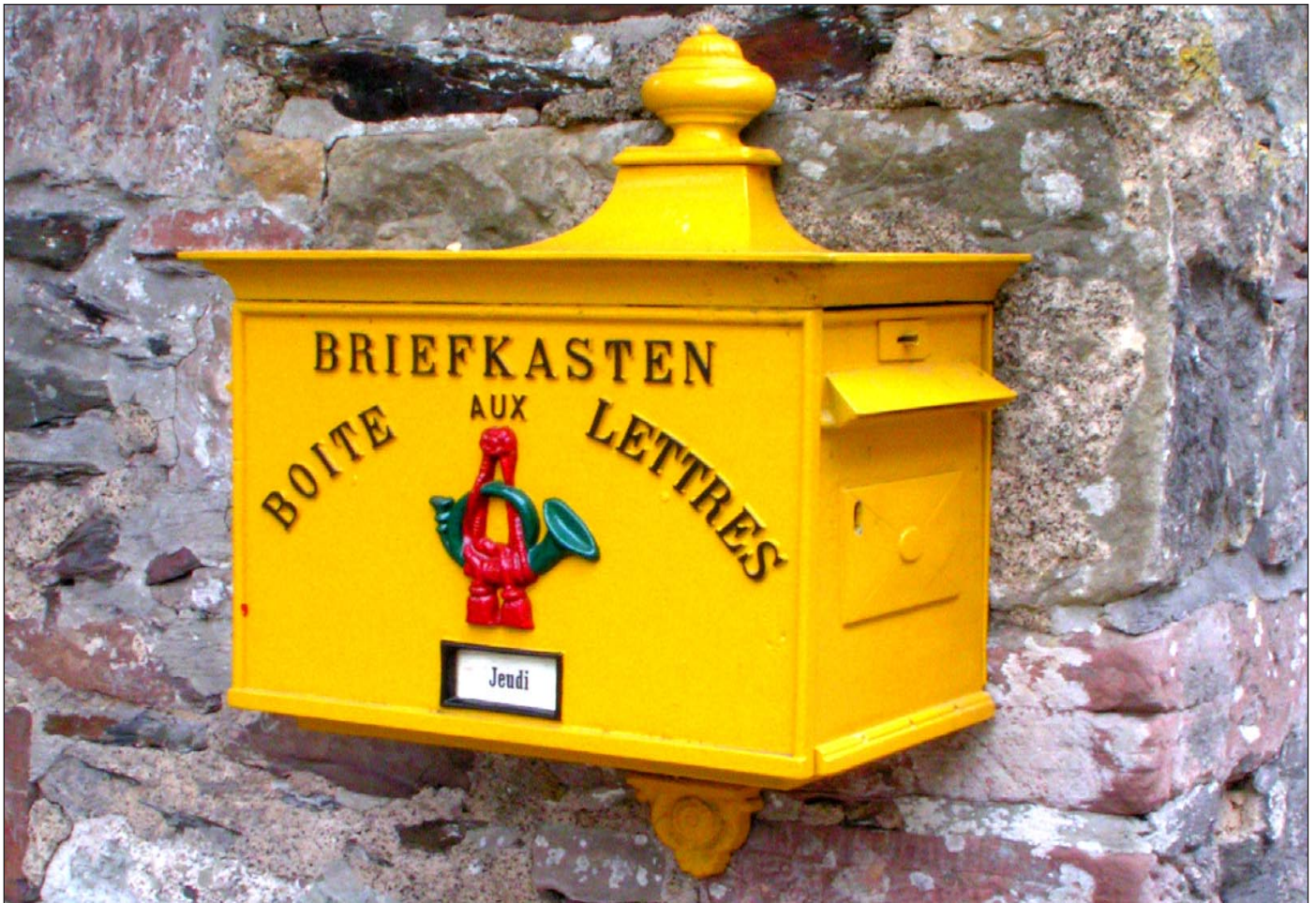
Briefkasten in der luxemburgischen Stadt Vianden