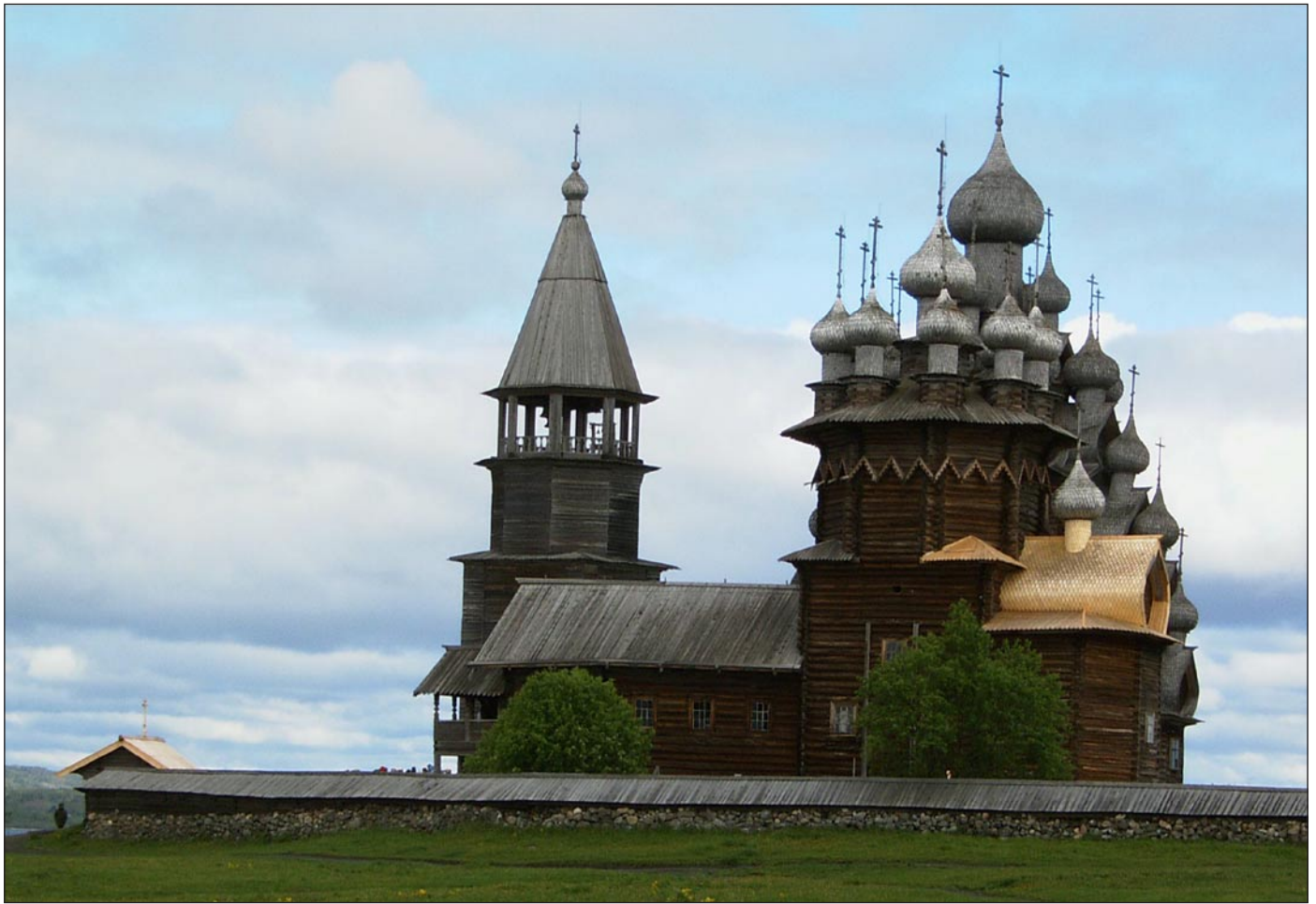
Verklärungskirche auf der Insel Kischi im Onegasee, gebaut 1714