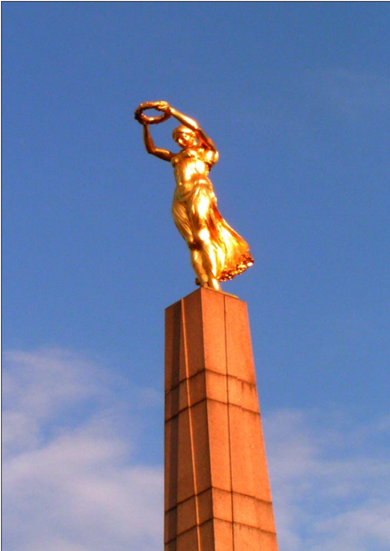
Denkmal für die Unabhängigkeit in Luxemburg-Stadt