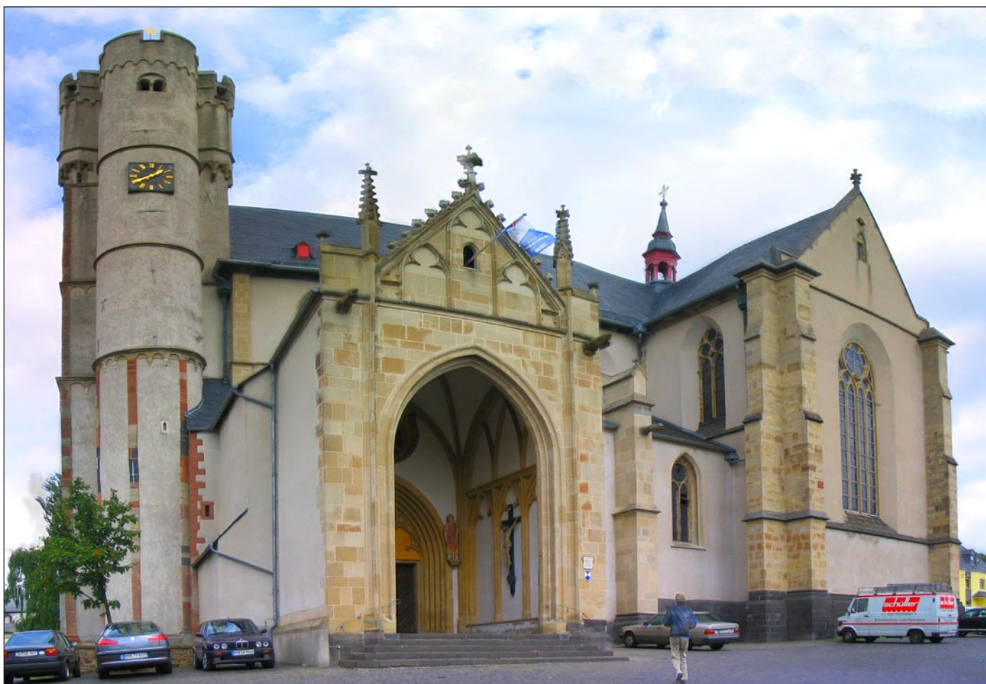
Ehemalige Stiftskirche St. Martinus & St. Severus in Münstermaifeld an der Mosel, errichtet 1225 bis 1322