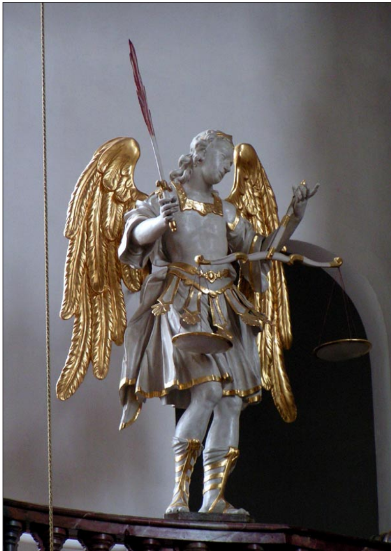
Engel auf dem Altar der Wallfahrtskirche Steinhausen