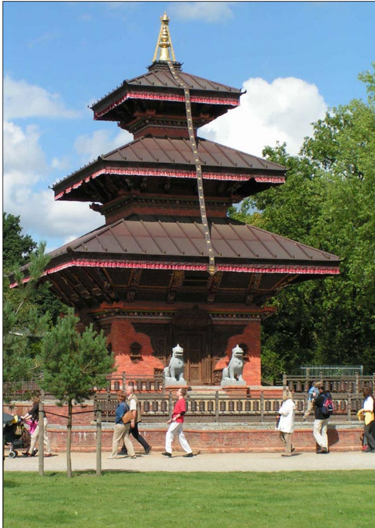
Pagode am Haupteingang von Hagenbecks Tierpark in Hamburg