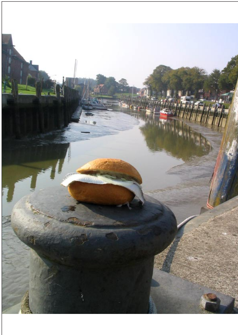
Fischbrötchen in seinem natürlichen Habitat in Norddeutschland, aufgenommen im Hafen von Tönning