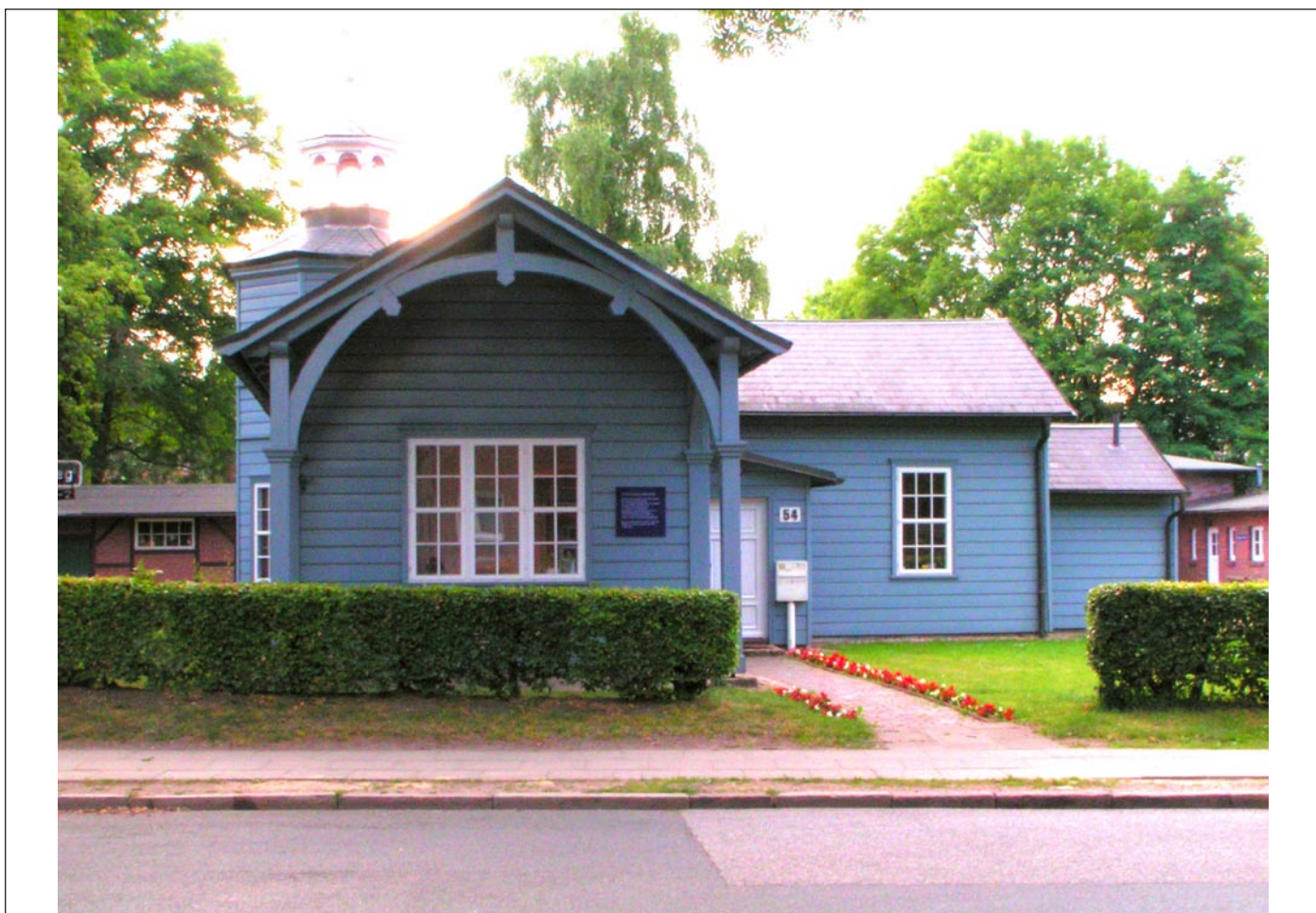
Alter Bahnhof in Hamburg-Bergedorf, zweitältestes erhaltenes Bahnhofsgebäude in Deutschland, errichtet 1842 nach Plänen von Alexis de Chateauneuf