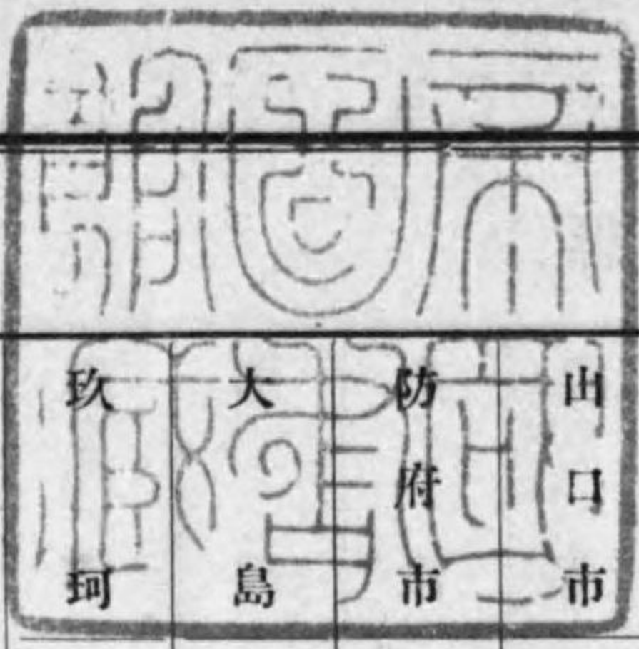
鑛區數及坪數郡市別一覽表