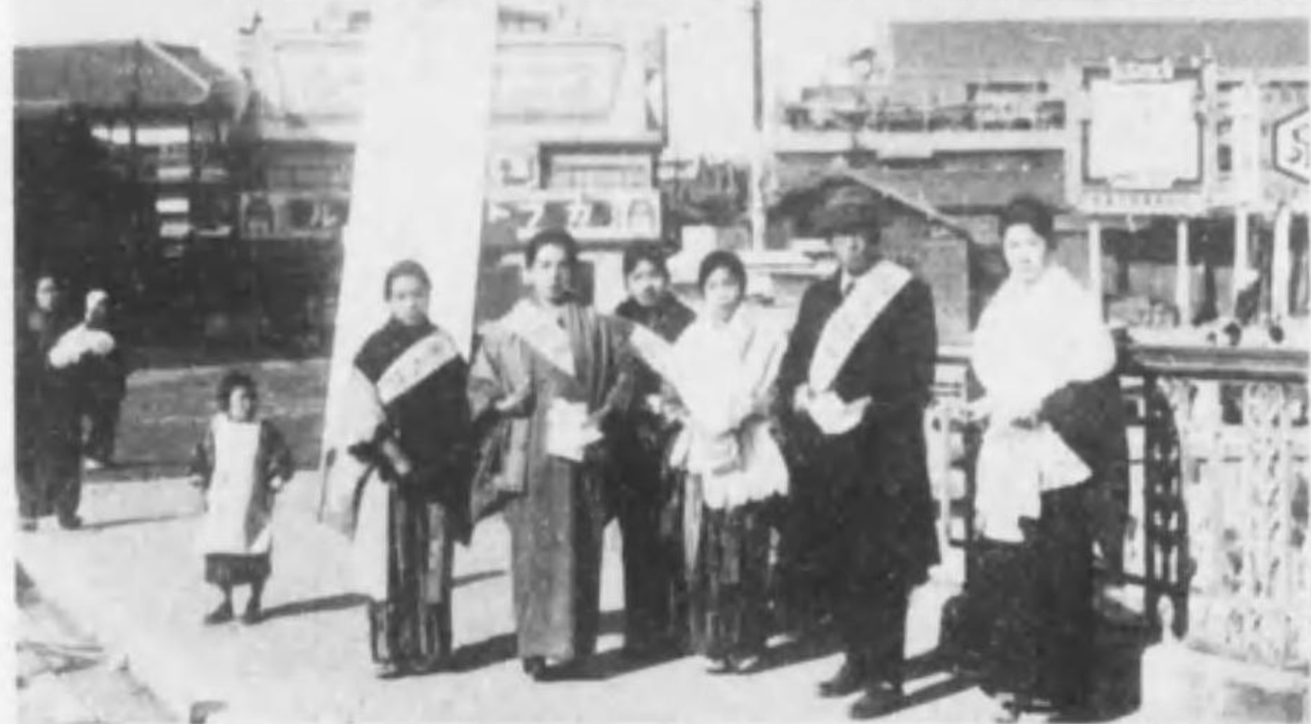
← 一如會地方支部ノ融和 日ニ於ケル活動實況