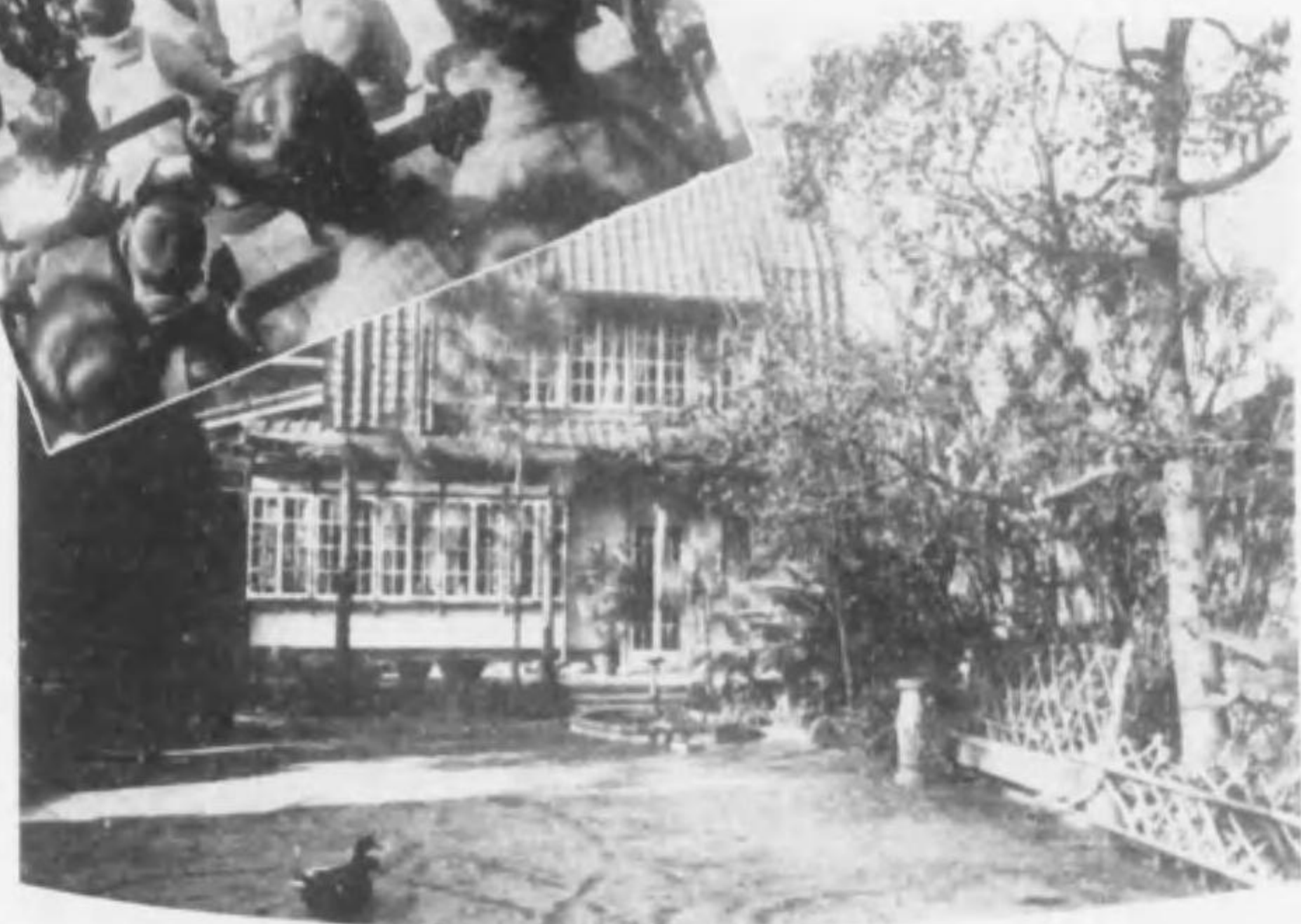
↓ 光徳寺善隣館全景