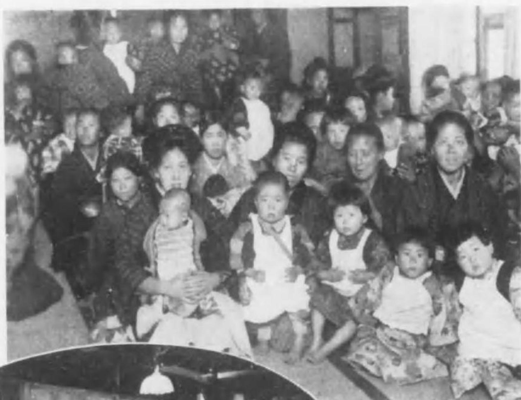
第一回乳兒健康相談所實況

教團の行ふ社會事業は云ふまでもなく宗教宣布の報恩行中に行はるべきものであつて、その宗教的報恩行中に人格陶冶がよりよく工夫されるのであるから、能うるならば斯業が恰も外國に於けるが如く宗教家の手を通じて行はれるようになることを希望する。そこまで宗教家は社會的に進出すべく、社會人も亦宗教家を動かすようになりたいのである。抑も寺院又は教會は、その道場をたゞ老人者流に限らしめず、各々適當した施設によつて婦人、處女、青年、少年、幼年