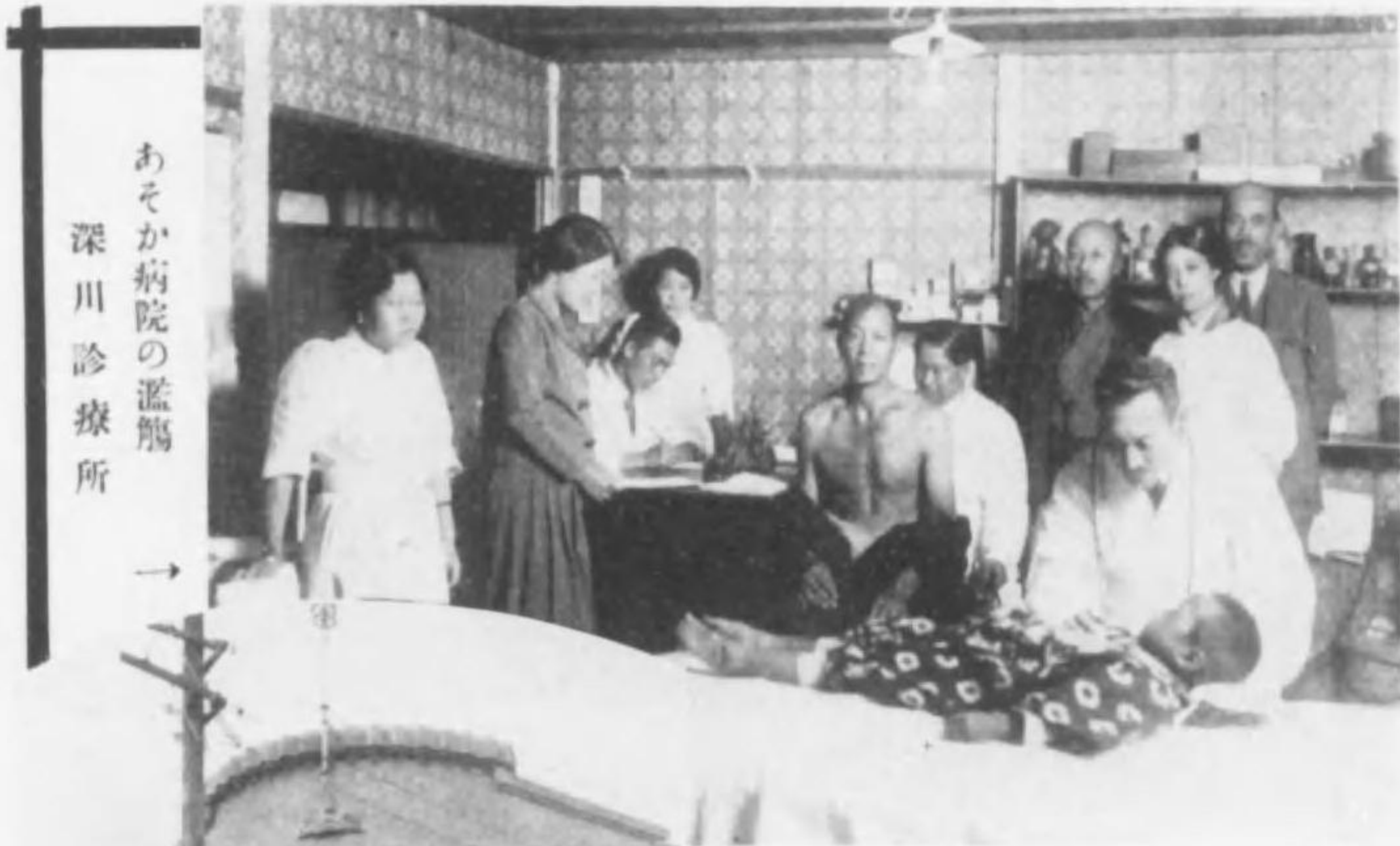
あそか病院の 深川診療所 の 監 視