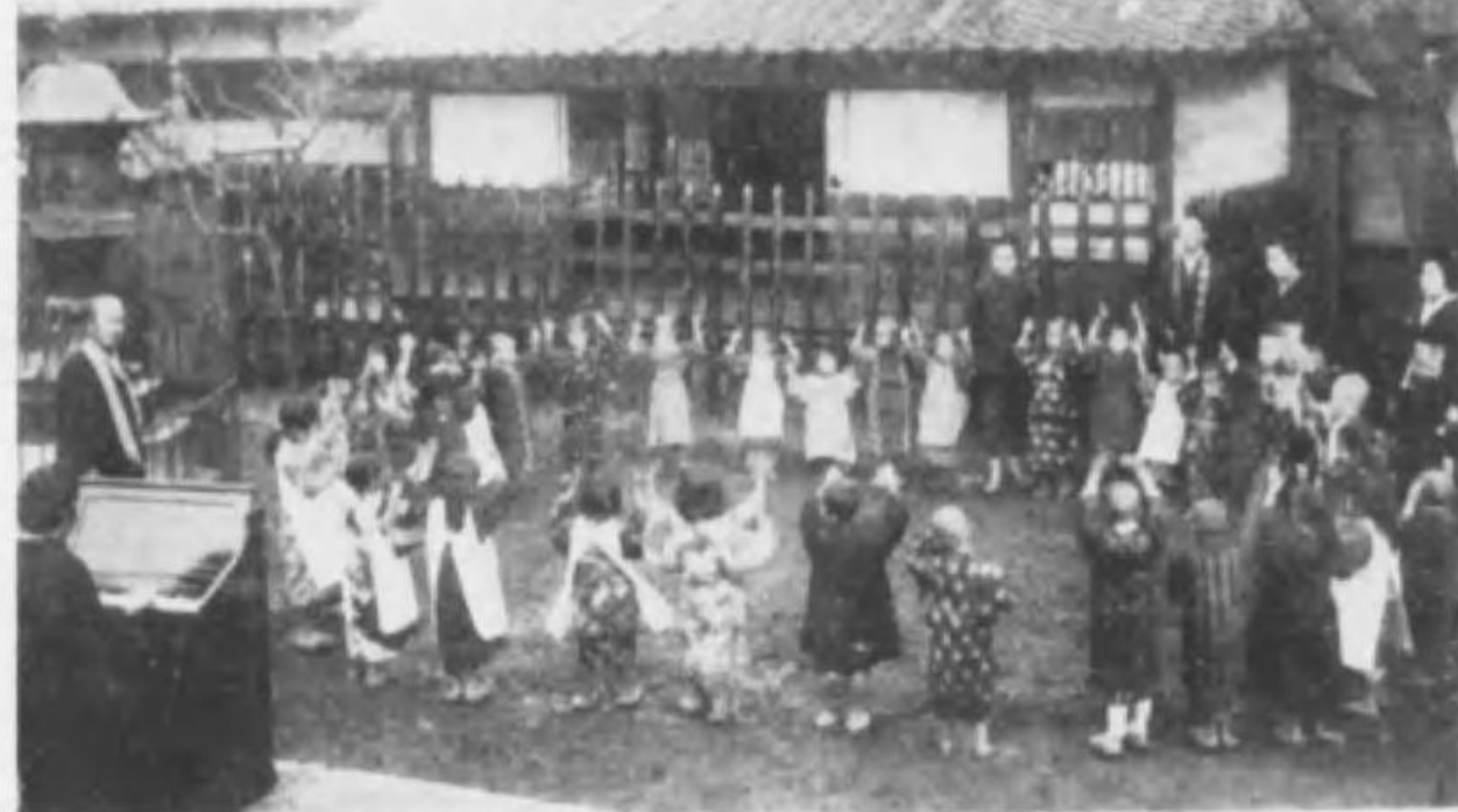
→ 愛國護法永照寺婦人會 東部託兒所