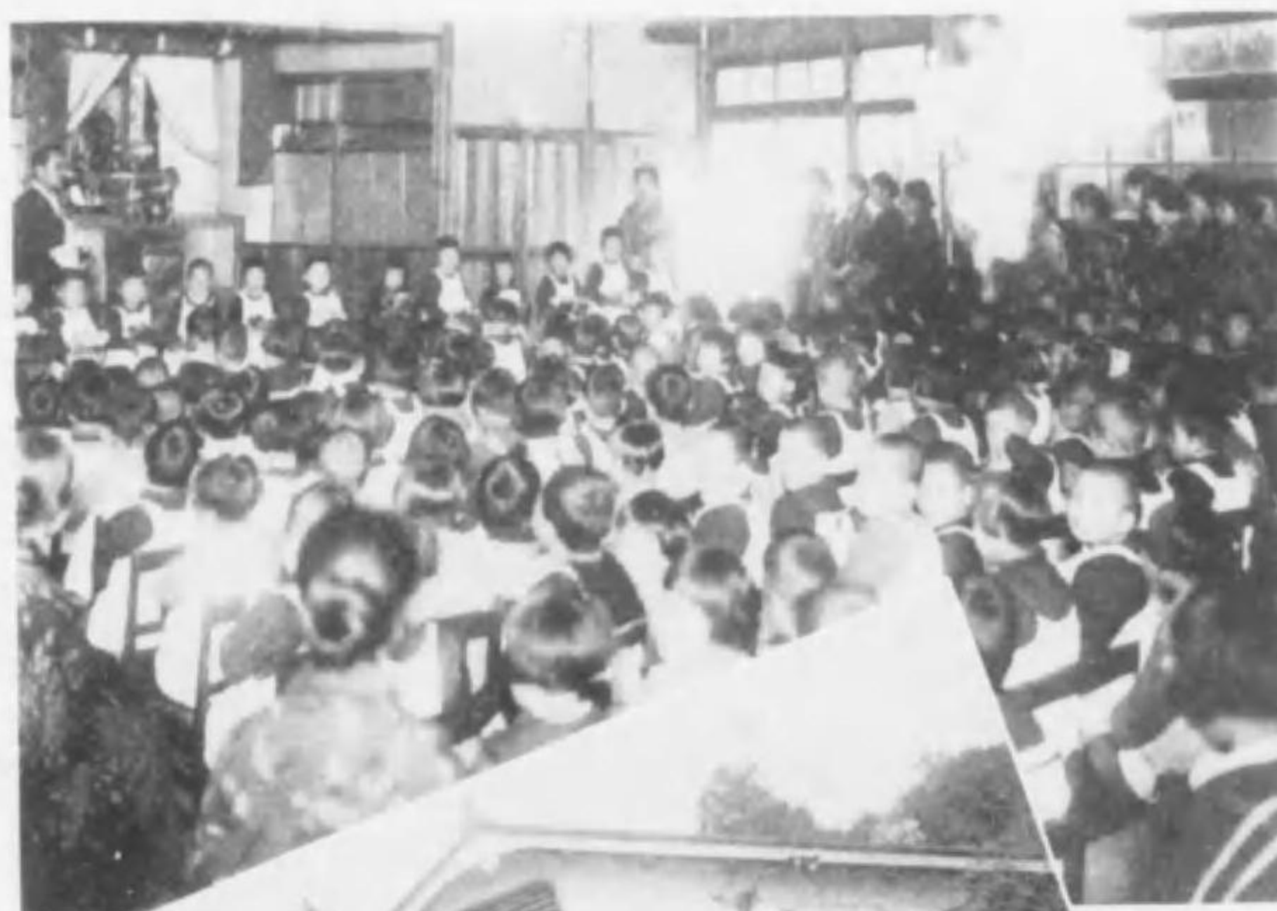
京都幼稚園 並本派本願寺保母養成所生徒