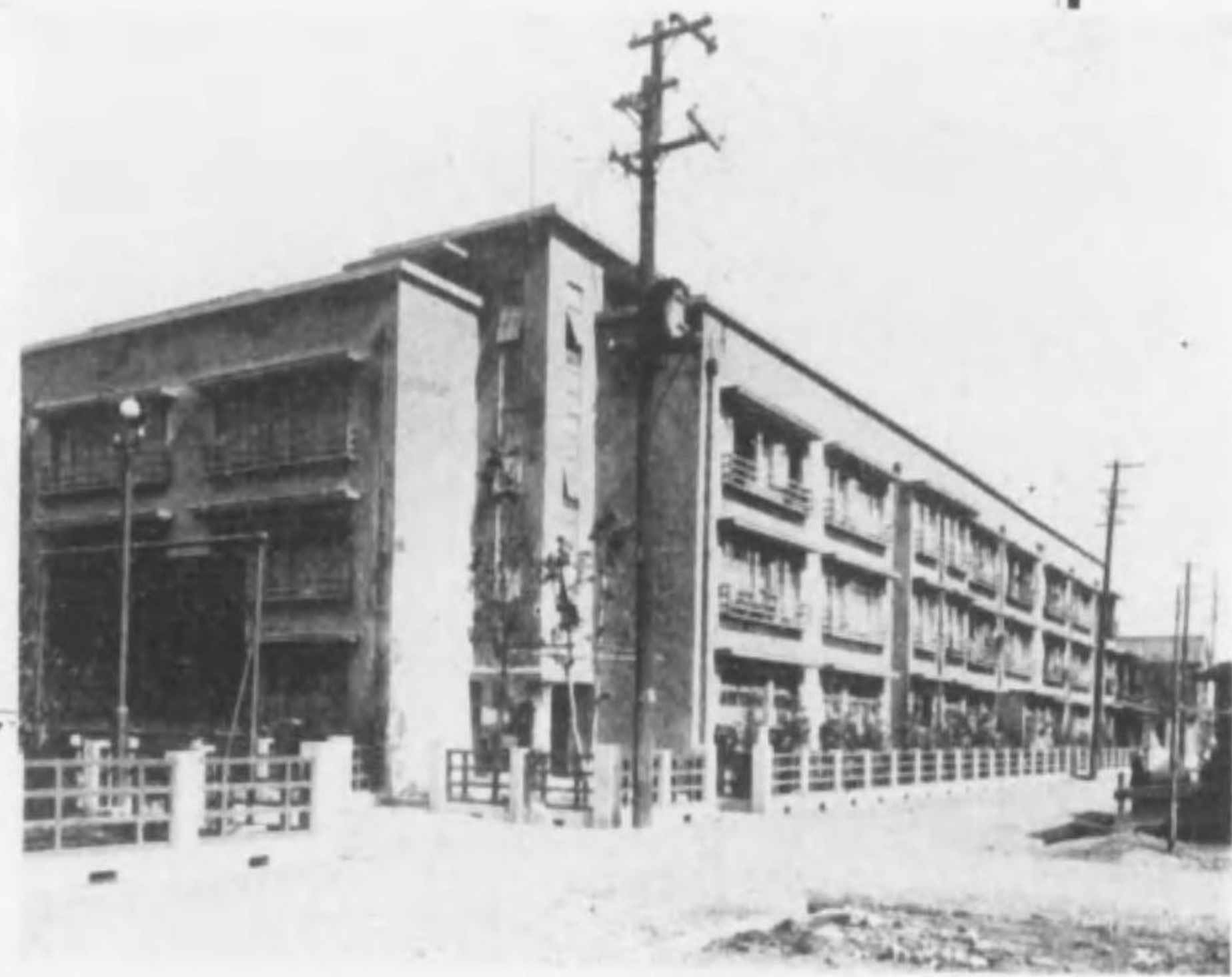
同 附 屬 ア パ ー ト の 一 部