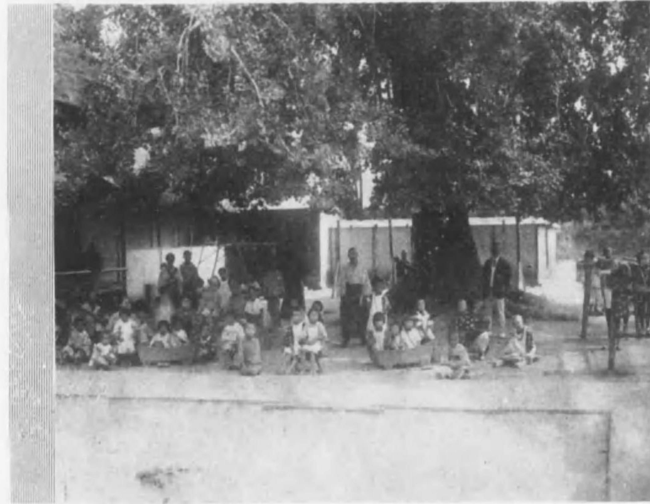
(下)……所見託内綿 (上)……所見託期繁蠶柄富