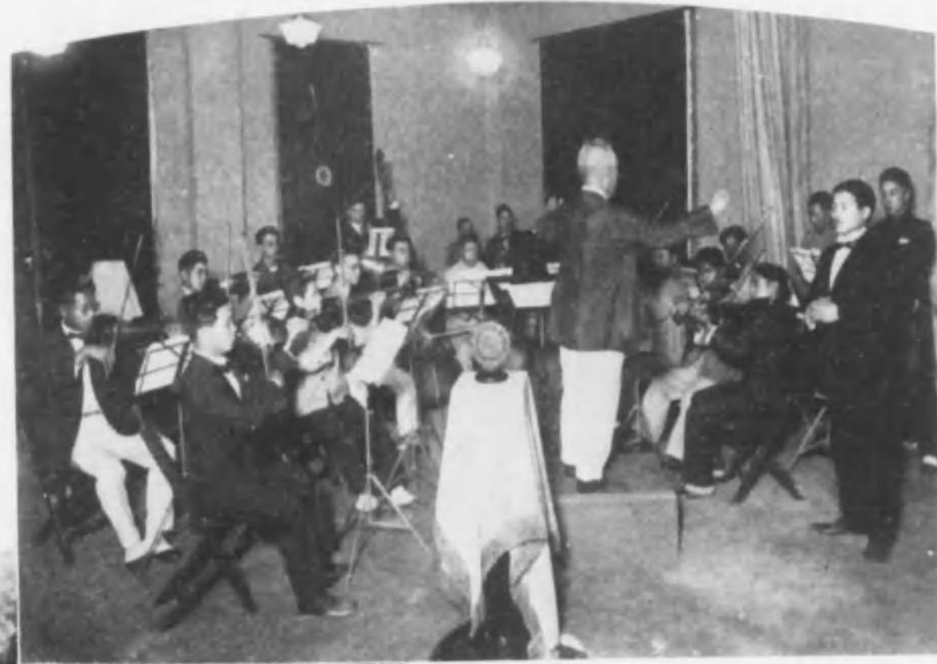
→ 淨寶寺佛教青年會 管絃樂團 (放送)