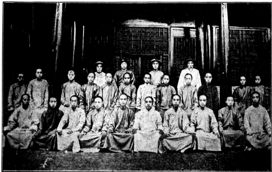
堂 學 小 州 祁