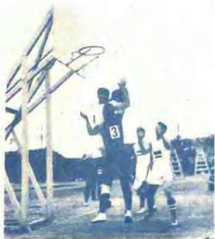
中 非 球 決 賽