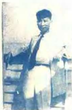
足球總教練馬德龍