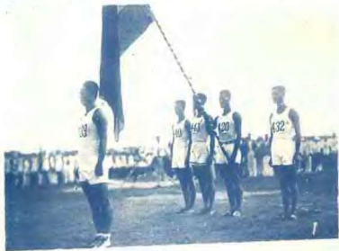
警宣手選國中 (右)翔夏(旗護)岩金(手旗)平愈蔡(者警宣)