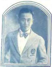
三級跳章第四司徒光