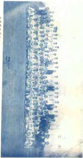
手 選 體 全 華 中