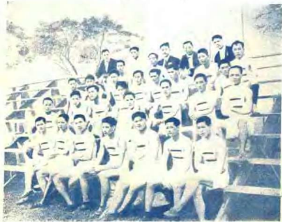
中華全體選手合影