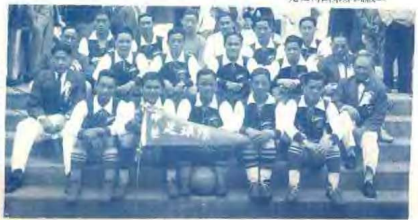
中華足球隊不幸與日本並列冠軍