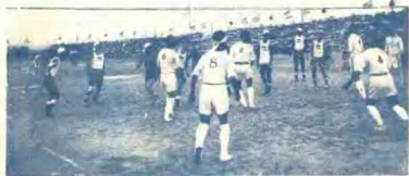
中 日 排 球 決 賽