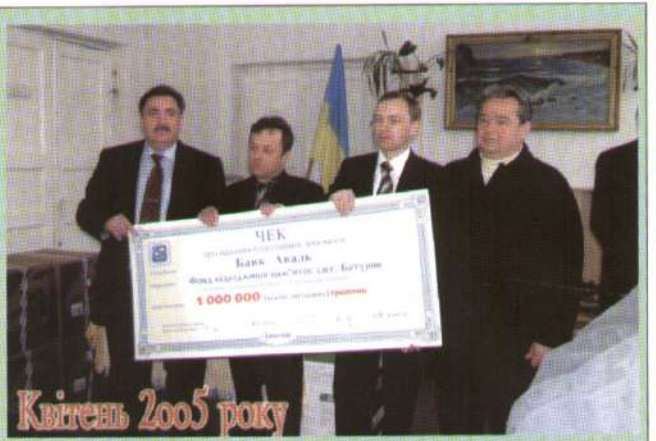
Квітень 2005 року

Асфальтівка петляла на Прилуки, а перед очима чомусь усе чіткіше виринали спомини про дитинство... Прошло воно під крилом великого і славного козацького села Кобижча. В ті часи, коли його нинішнє покоління п'ятдесятилітніх, як кажуть, під стіл пішки ходило, було воно одним із найбільших в Україні. Понад дванадцять тисяч мешканців, дві середні школи, в яких навчалися у дві зміни, веселі молодіжні вечорниці по кутках, спортивні ігри та художня самодіяльність. Село вже залічило বেশні рани і дивилося в майбутнє.