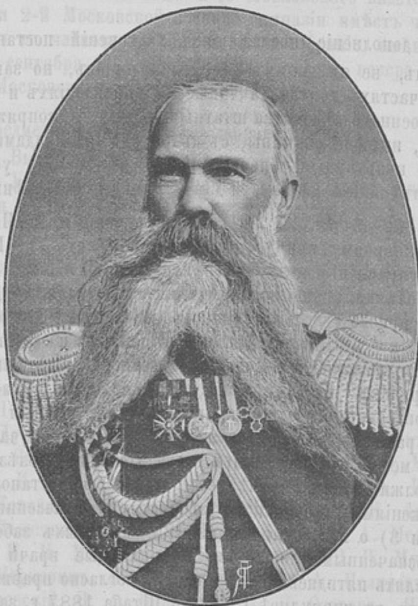
Начальникъ штаба Приамурскаго военнаго округа, Генераль-Маіоръ

Родился въ 1832 г. Воспитывался въ Павловскомъ кадетскомъ корпусѣ, откуда, изъ фельдфебелей, вступилъ въ службу въ 1852 г. поручикомъ въ егерскій Его Имп. Выс. В. Кн. Михаила Николаевича полкъ. Въ слѣдующемъ году переведенъ л.-гв. въ Гренадерскій полкъ. Въ 1856 г. окончилъ курсъ въ Николаевской академіи генеральнаго штаба, назначенъ на службу въ Восточную Сибирь и въ 1858 г. переведенъ въ генеральный штабъ. Въ теченіе службы въ Восточной Сибири былъ командированъ въ Сѣв. Монголію и въ г. Пекинъ и принималъ участіе въ работахъ по разграниченію Приамурскаго края. Произведенъ въ полковники въ 1865 г., въ генераль-маіоры въ 1878 г., а въ генераль-лейтенанты въ 1889 г. Занималъ должность начальника штаба 29-й пѣх. дивизіи, съ 1863 по 1867 г. Назначенъ: командиромъ 61-го пѣх. Владимирскаго полка въ 1867 г., помощникомъ начальника штаба Московскаго воен. округа въ 1877 г., комендантомъ Выборгской крѣпости въ 1889 г., а начальникомъ 25-й пѣх. дивизіи въ 1891 г. Участвовалъ въ кампаніяхъ 1854 и 1863 гг. Въ 1892 г. награжденъ орденомъ Вѣлаго орла. Числится по армейской пѣхотѣ.