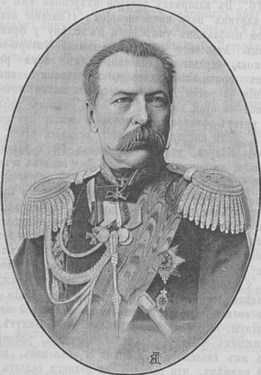
Начальникъ 25-й пѣх. дивизіи, Генераль-Лейтенантъ