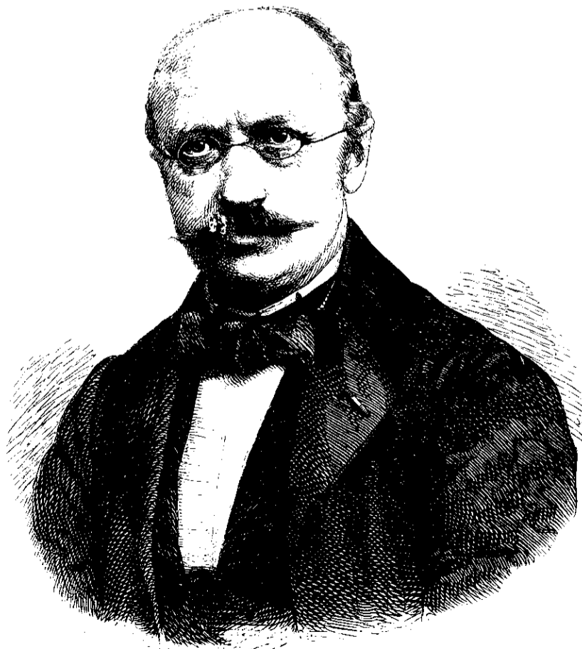
Daniel German Anton Melbye.

En Dag, da han i mørke Betragtninger drev om paa Kongens Nytorv, mødte han en Skolekammerat, nu Lærling ved Academiet. Det var just Udfillingens sidste Dag og den var derfor efter Skik og Brug aaben for Dyr. Lærlinger. „Har Du Lyst, at see Udfillingen?“ spurgte Kammeraten. „Na-aa ja.“ — „Saa kan Du gaae derop paa min Seddel!“ — „Men kan det gaae an?“ — „Nei, det kan det igrunder ikke, men naar Du bare gaaer rask ind af Døren og lader som Jugenting, saa seer de ikke Andet, end at Du er Kunstner,“ — og saa gik Anton Melbye op paa Charlottenborg. De-