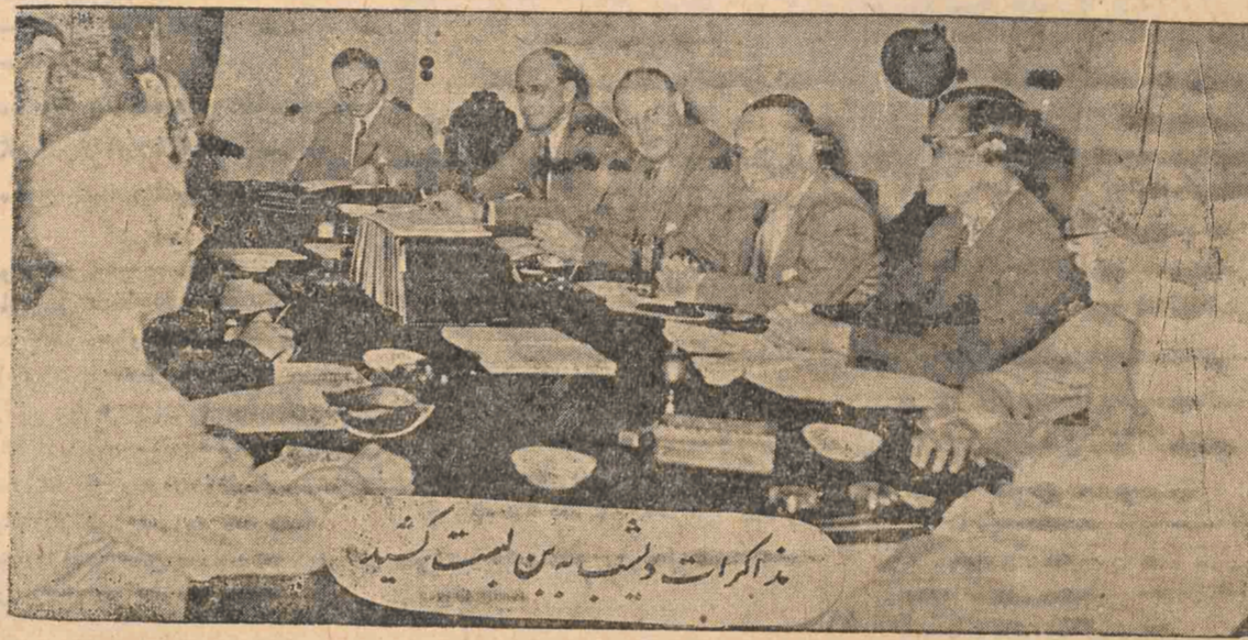
مذاکرات شب بین است کشید

حکومت ایران گناه را بگردن شرکت گذارده و معتقد است که شرکت با تهدید و تخویف میخواهد مقاومت ملی ایران را