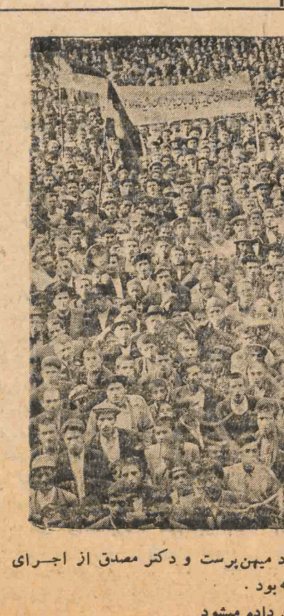
چندین هزار نفر از مردم همدان بطرفداری از منویات جبهه ملی و افراد مبین پرست و دکتر مصدق از اجرای قانون ملی شدن نفت و خلق یدمینیک با عظمتی دادند که طی چند سال اخیر بی سابقه بود در این عکس گوشه ای از میدان و تظاهرات اهالی نشان داده میشود