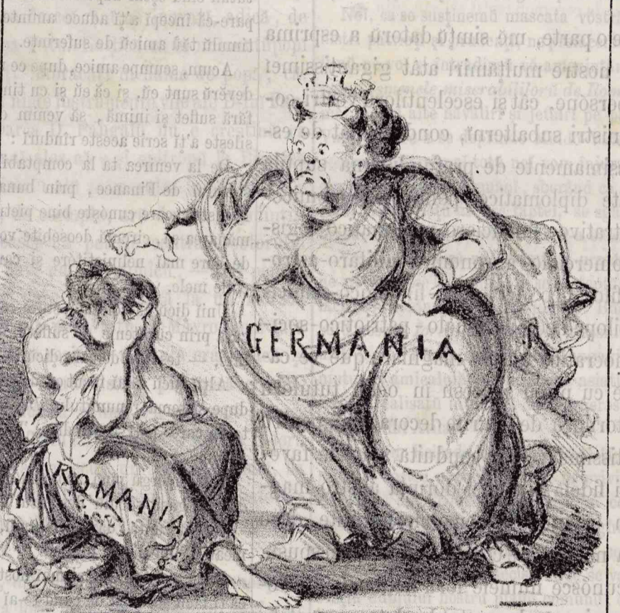
Scopul meu e pe jumătate realizat.