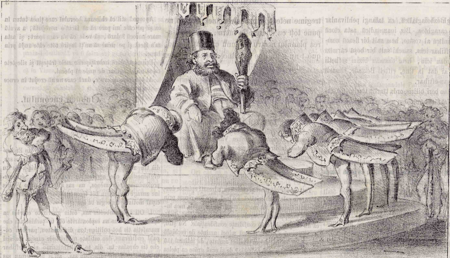
Supușii mei, veți cauta în toate clasele societății spre amé înconjora de tot ce e onest și capabil.