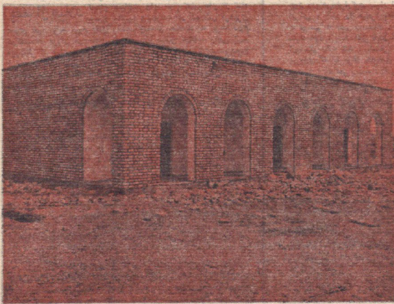
این نمای ساخته شده یک مدرسه از مدارس یادبود جشن هسای شاهنشاهی است که در گوشه و کنار کشور ساخته شده و میشود سهم استان خراسان از این گروهندترین و انسانی ترین یادبودها ۲۱۴ مدرسه است. در این زمینه مجامعه و گفتگوی داریم که در صفحه هفتم چاپ شده است.