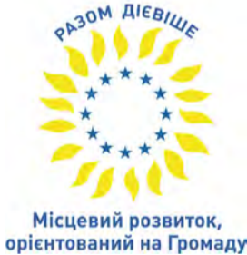
Місцевий розвиток, орієнтований на Громаду