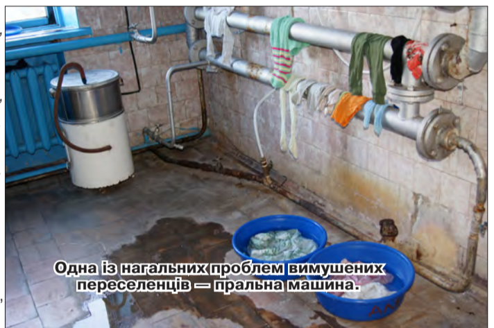
Одна із нагальних проблем вимушених переселенців — пральна машина.