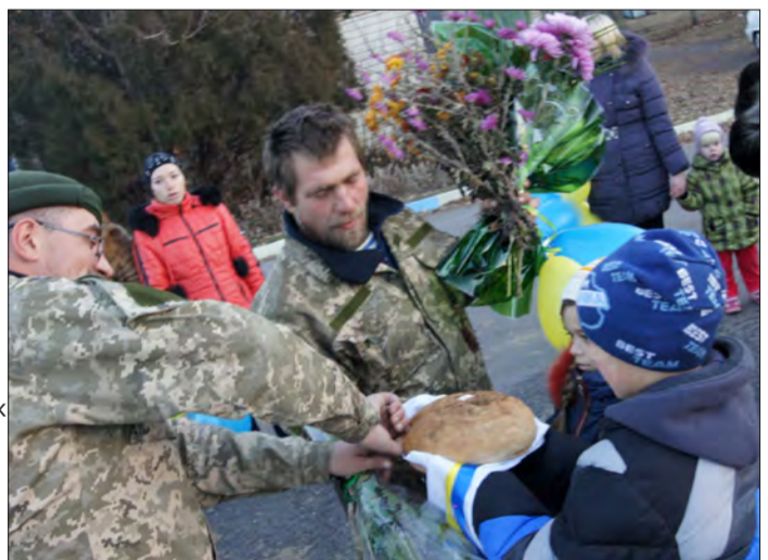
Дістає з лівої нагрудної кишені оберіг, виготовлений дитячими руками: шеврон у вигляді ляльки із національною символікою: