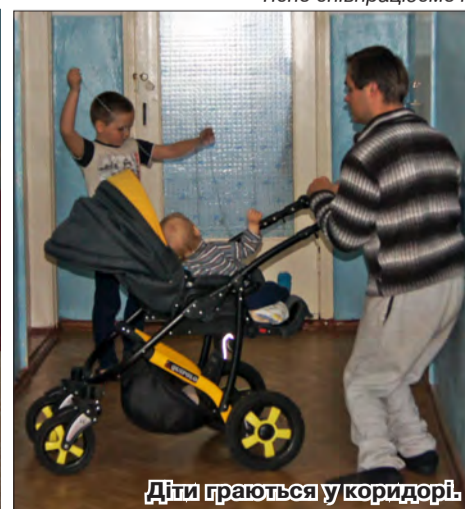
Діти граються у коридорі.