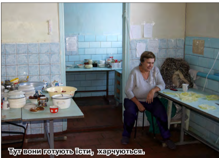
Тут вони готують їсти, харчуються.