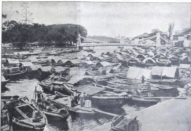
။ မြန်မာ့နိုင်ငံရေးအဖွဲ့အစည်းများ၏ အကျိုးကျေးဇူး ။

မြန်မာ့နိုင်ငံရေးအဖွဲ့အစည်းများ၏ အကျိုးကျေးဇူး၊ မြန်မာ့နိုင်ငံရေးအဖွဲ့အစည်း၏ အကျိုးကျေးဇူး၊ မြန်မာ့နိုင်ငံရေးအဖွဲ့အစည်း၏ အကျိုးကျေးဇူး၊ မြန်မာ့နိုင်ငံရေးအဖွဲ့အစည်း၏ အကျိုးကျေးဇူး