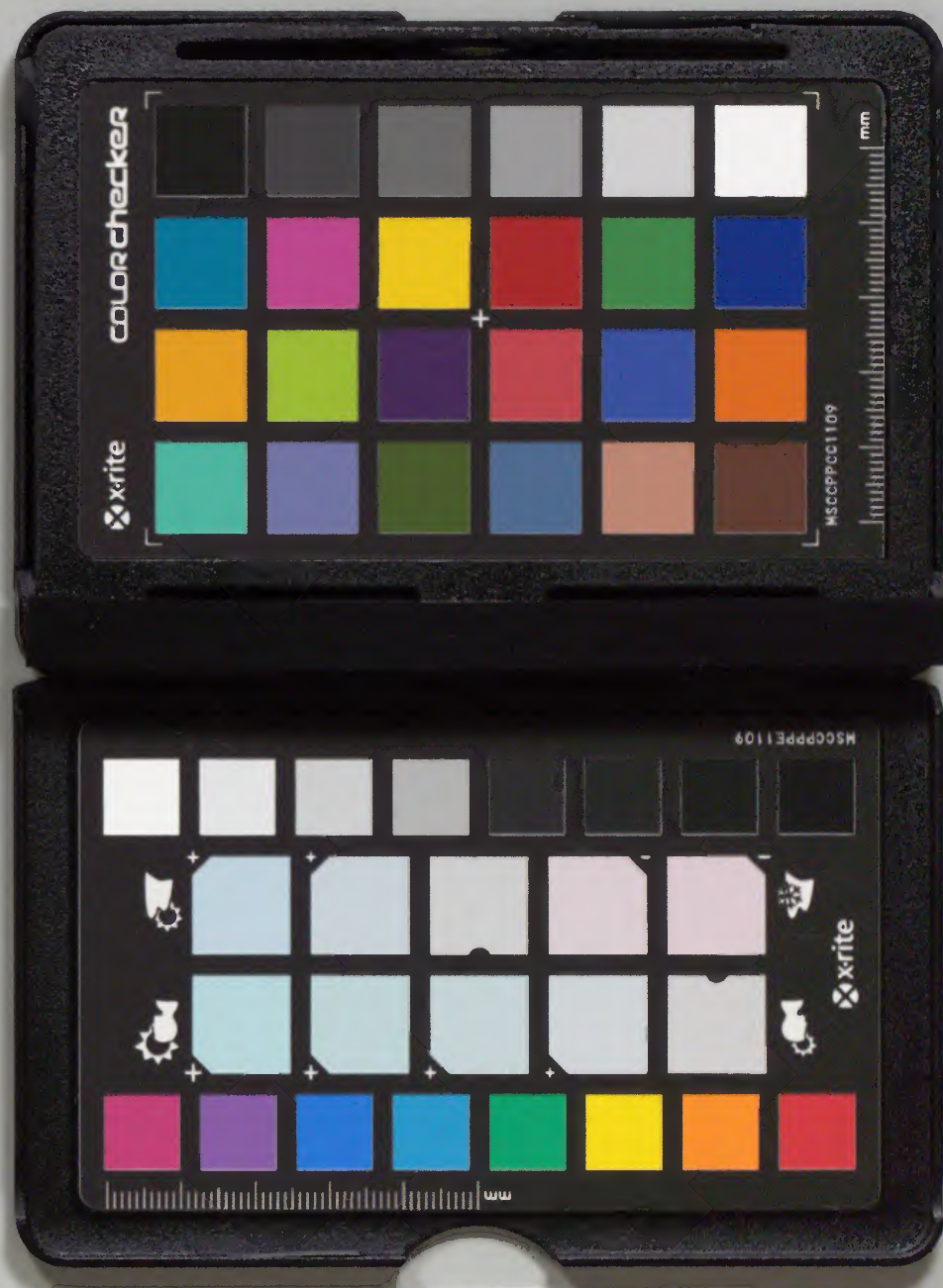
綴じ部(喉部分)の文字など開きが不鮮明な箇所あり