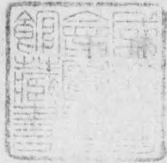
表 情 報 誌