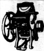
此圖乃本廠所製之印刷機也