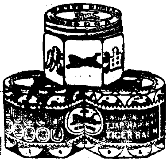
吧城時代印製公司承印

虎標鮮艷人人識 品質精良世無敵 頭痛最好頭痛粉 靈藥有益而無損 心煩合用八卦丹 事務雖多也了閑 便閉且服清快水 消熱解毒功之魁 或服或擦萬金油 萬病霎時化烏有 記取仰光永安堂 藥賣全球姓名揚